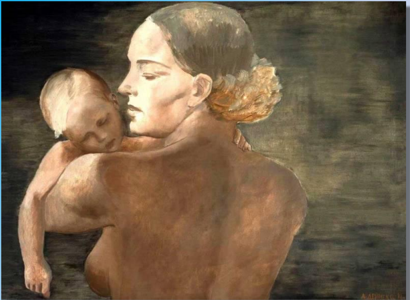
Дейнека А. А. (1899-1969) «Мать» , 1932 г. м. Государственная Третьяковская галерея