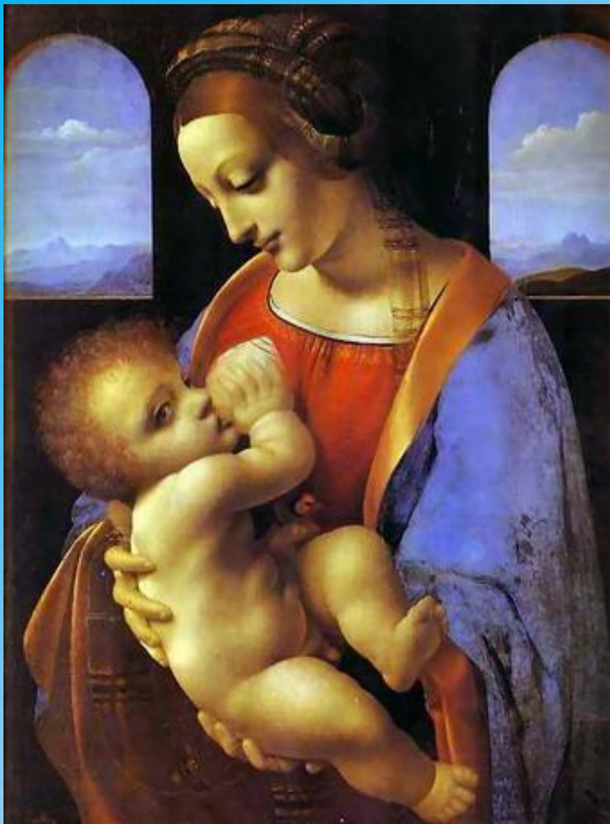
«Мадонна Литта» Леонардо да Винчи 1490-1491 г.г. Эрмитаж