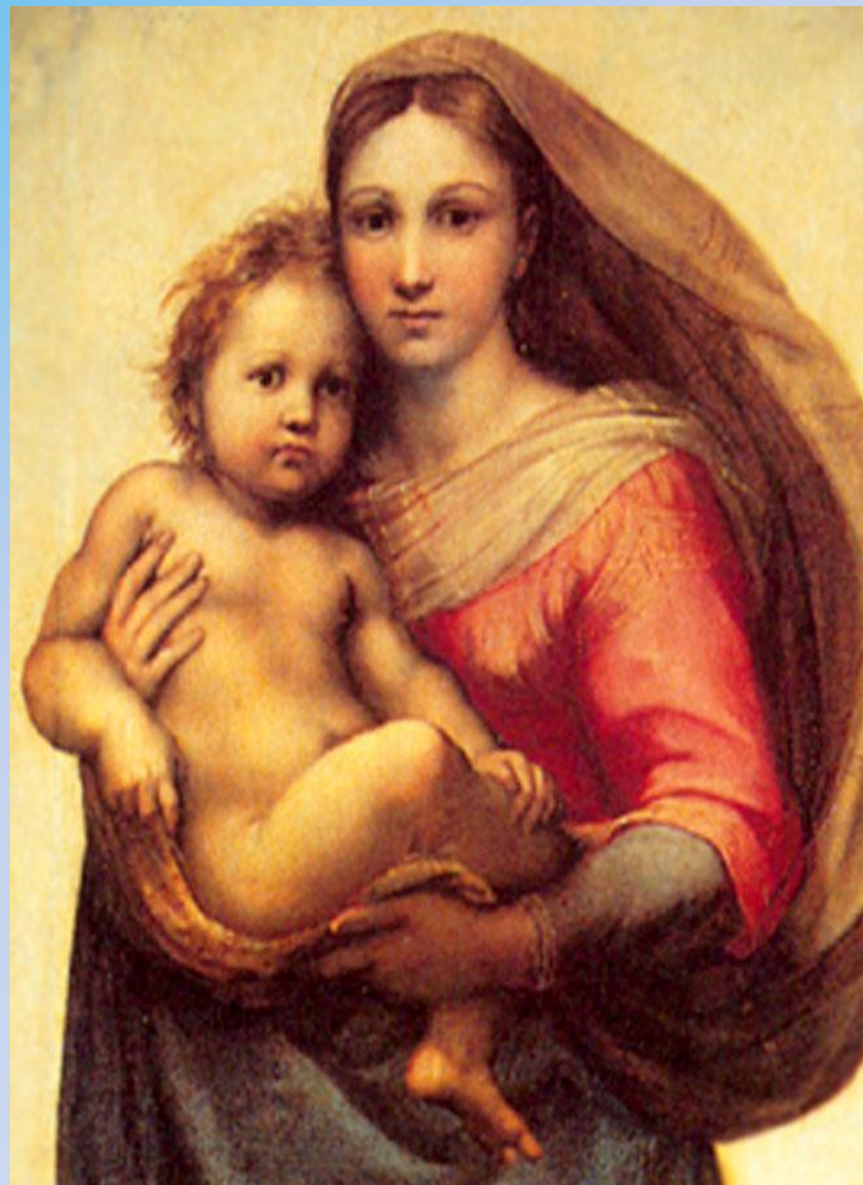
Рафаэль Санти «Сикстинская Мадонна» (фрагмент) 1513-1514 г.г.