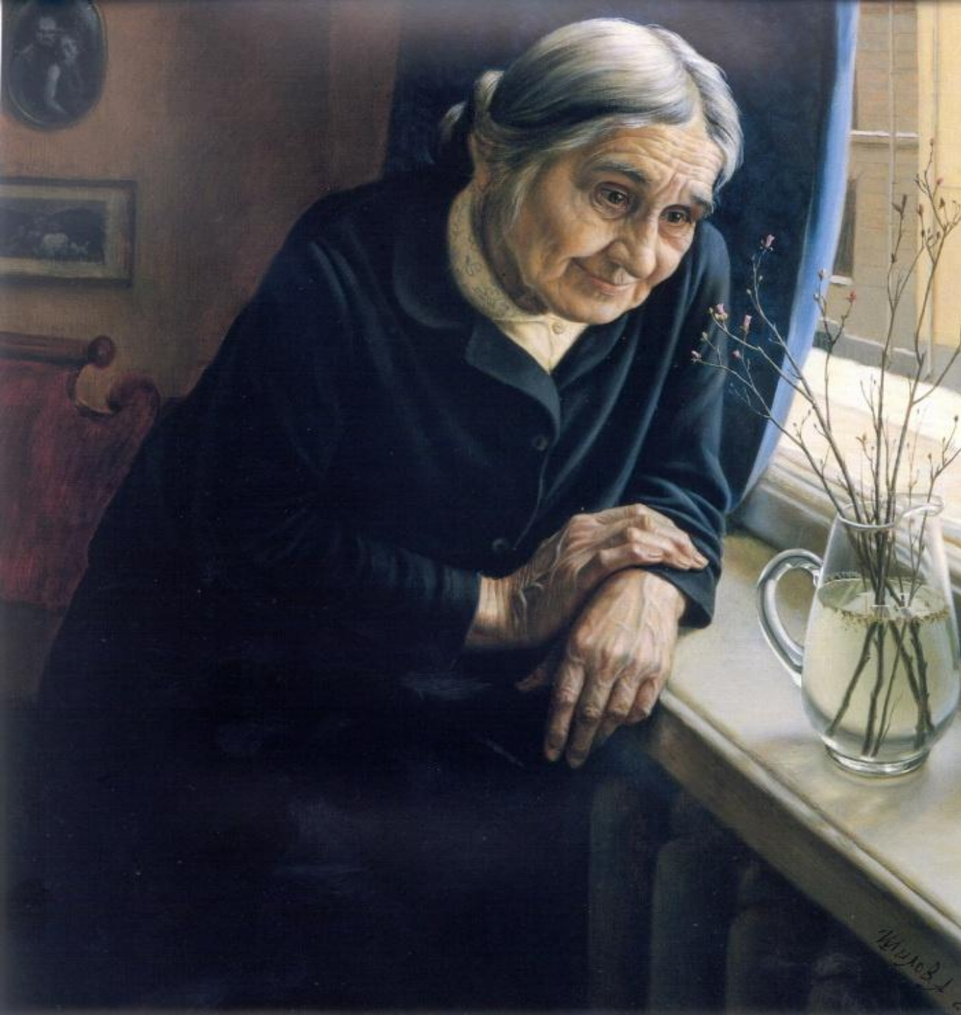
«Портрет» А. Шилов.