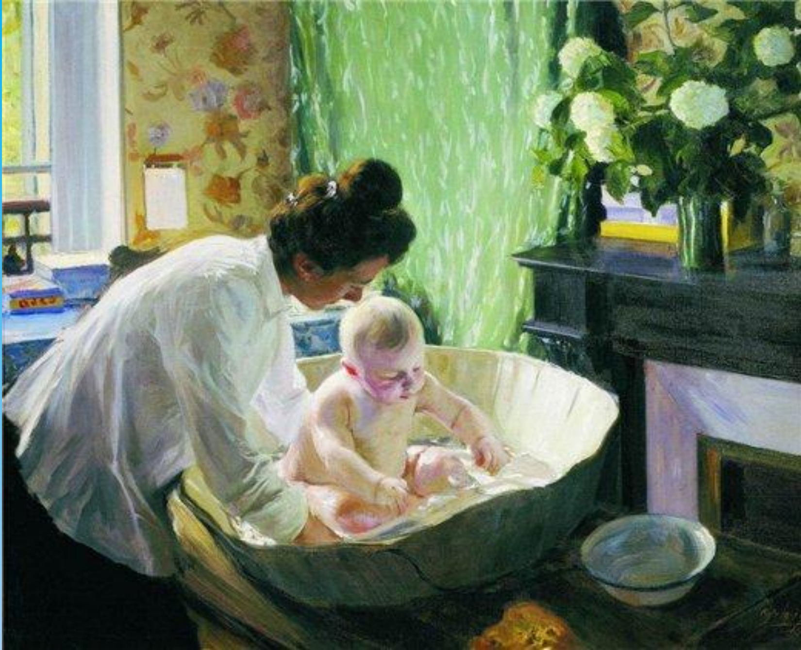
Кустодиев Борис Михайлович «Утро», 1903 г.