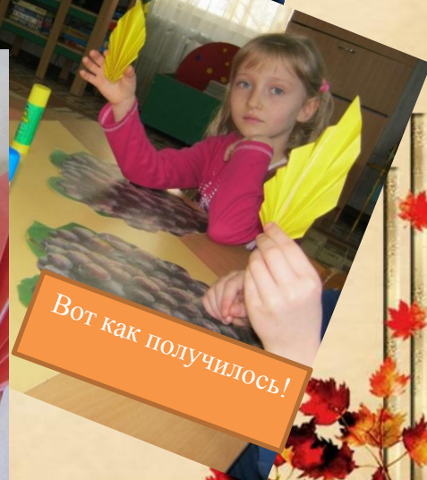
Вот как получилось!