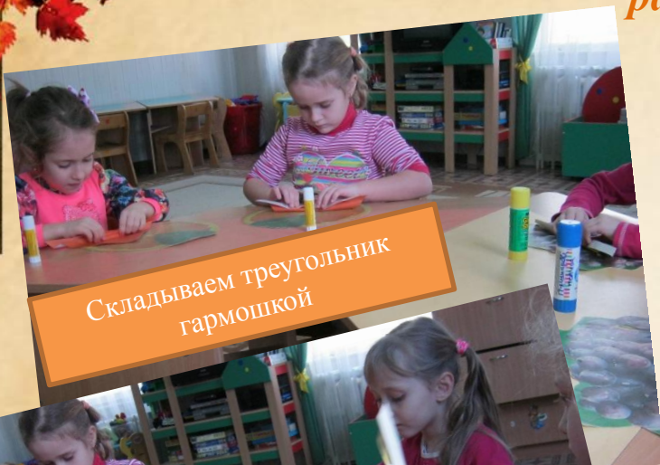
Складываем треугольник гармошкой