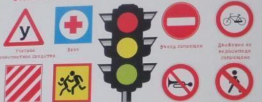
Въезд запрещен Движение на велосипедах запрещено Безопасный путь Переход для детей Светофор Подушка звукового сигнала запрещена Движение пешеходов запрещено