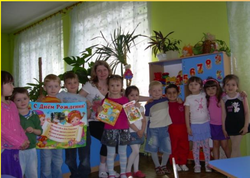
«С днем рождения»