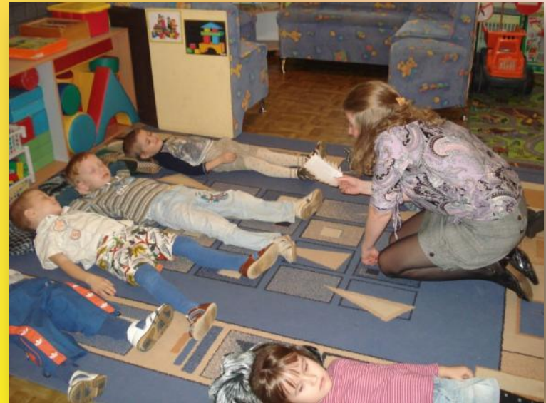
«Прогулка в лес»