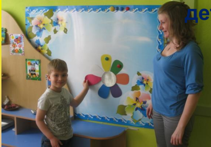
«Цветик – Семицветик»

«Дошкольный ребёнок – человек играющий, обучение входит в жизнь ребёнка через ворота детской игры».