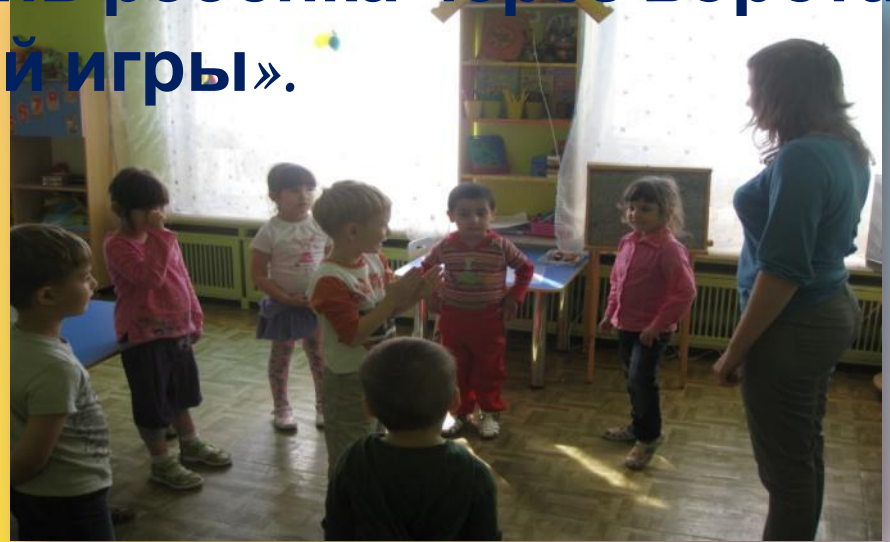
«Что мы делали не скажем...»