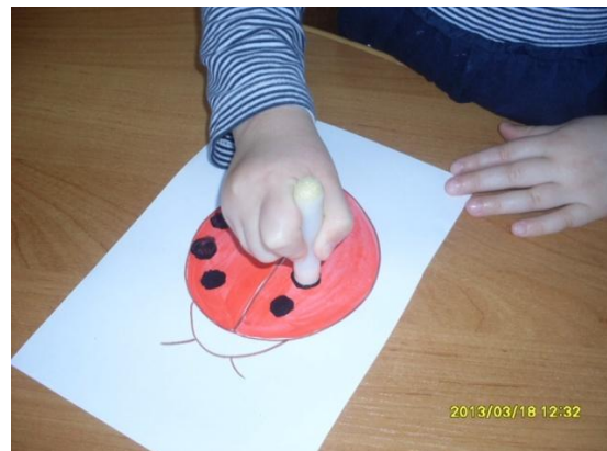
Рисование малым поролоновым тычком