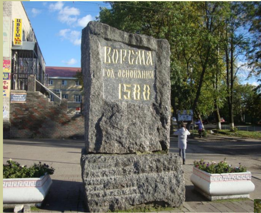
Камень-памятник, год основания Ворсмы 1588