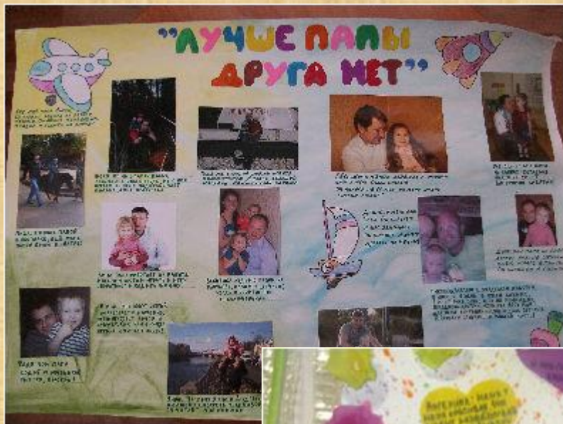
Фото и стенгазеты