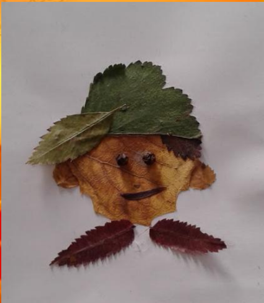
Любинский Арсений, 5 лет