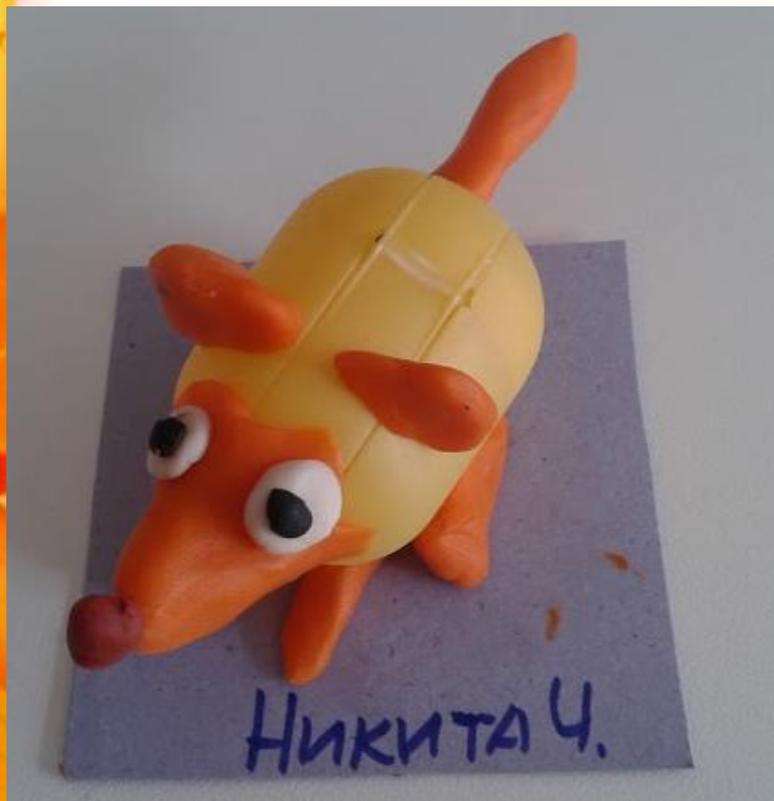
«Лисичка – рыжая сестричка» Чипышев Никита, 5 лет