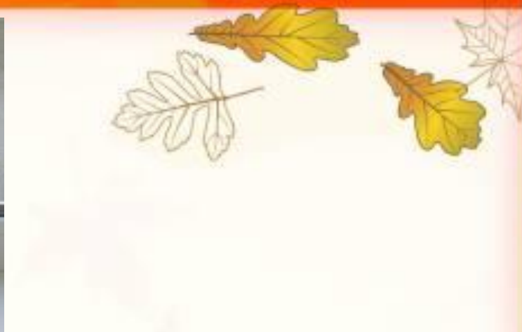
«Осенняя пора, очей очарованье Челпанова Полина, 5 лет