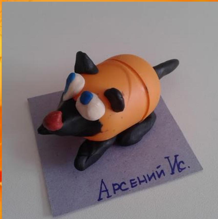
«Волчок - серый бочок» Исмагилов Арсений, 5 лет