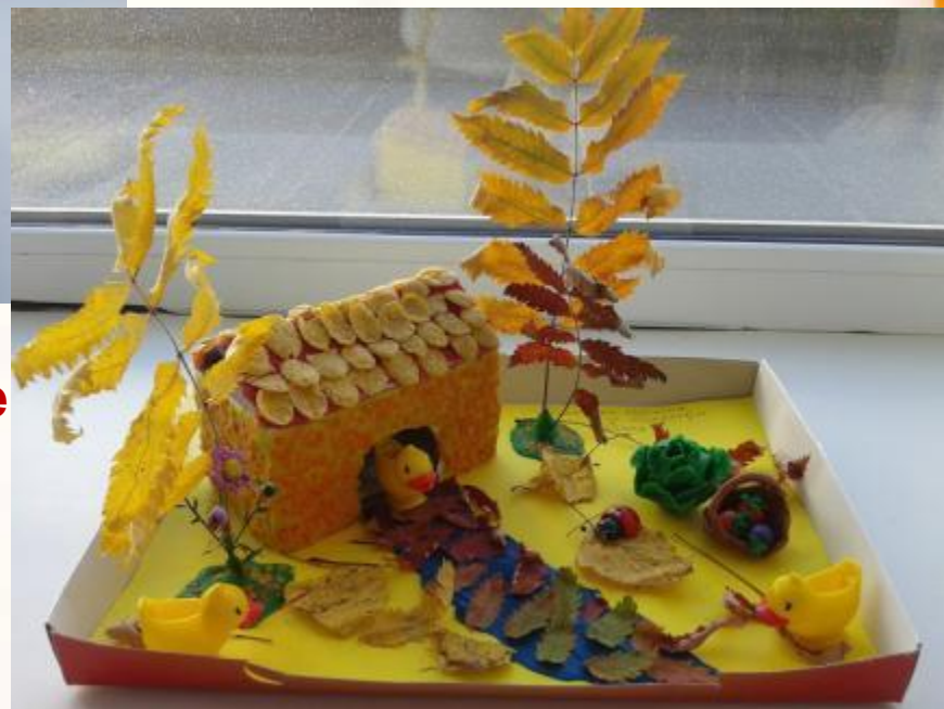
«Осенний дворик» Чипышев Никита, 5 лет