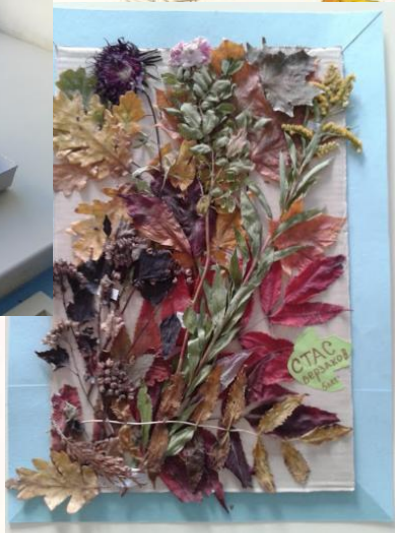
«Букет для Осени» Верзаков Стас, 5 лет