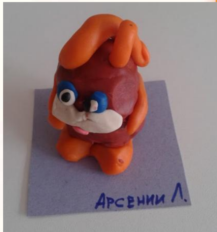
«Зайка – попрыгайка» Любинский Арсений, 5 лет