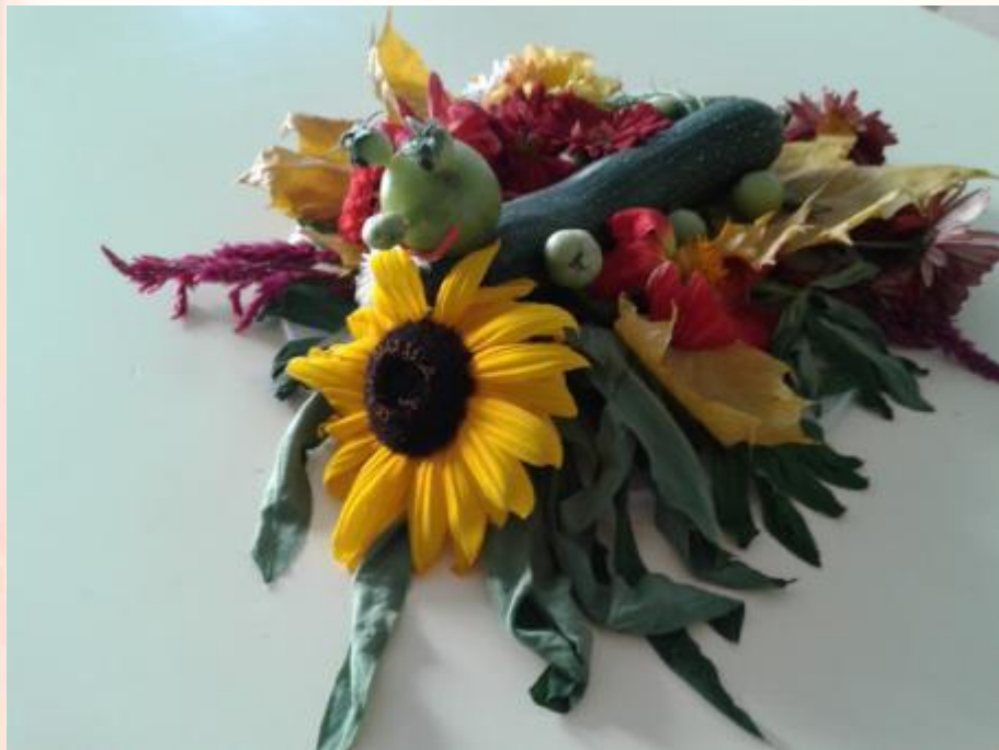
«Я на солнышке лежу...» Алексеевко Илья, 4 года