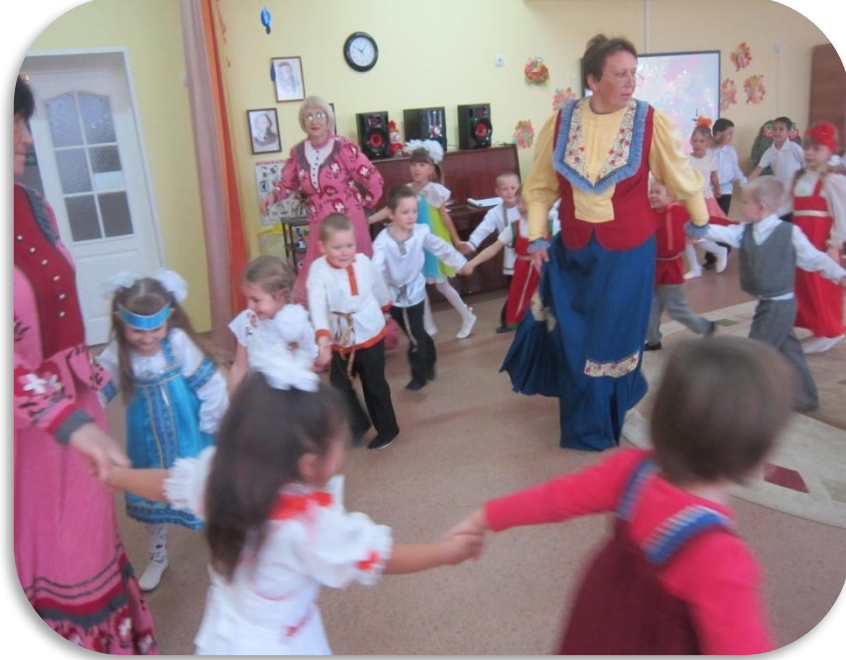
Хоровод "Вейся, вейся, капуста"

Есть обычай на Руси у кого ты не спроси? Люди на полях трудились и нисколько не ленились. Урожай все собирали и на зиму запасали.