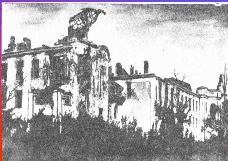
Корпус СХИ после освобождения Воронежа