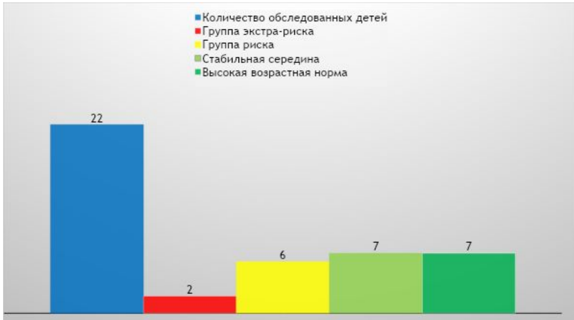
Диаграмма скрининга подготовительной группы №4