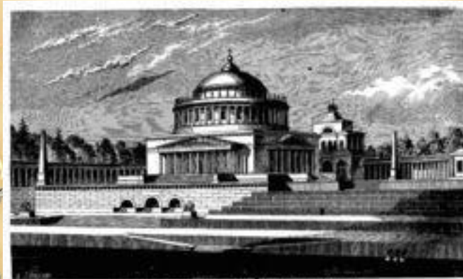
ХРАМЪ ХРИСТА СПАСИТЕЛЯ ВЪ МОСКВѢ, ПРОЕКТЪ АКАДЕМИКА ВИКТОРА.

В ознаменование победы в Отечественной войне 1812 года было поставлено множество памятников и мемориалов, из которых наиболее известными являются Храм Христа Спасителя (Москва) и ансамбль Дворцовой площади с Александровской колонной (Санкт-Петербург).