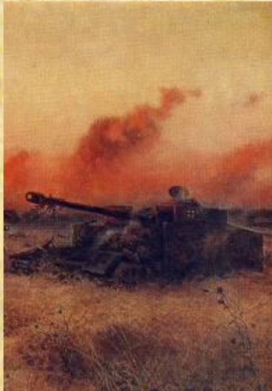
Курская «огненная» дуга