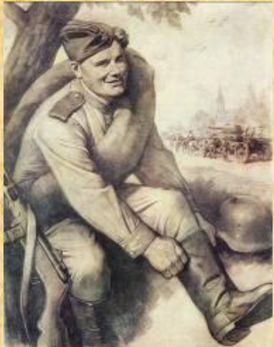
ДОЙДЕМ ДО БЕРЛИНА!