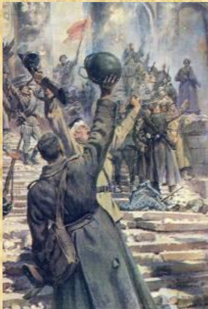
Белые флаги капитуляции