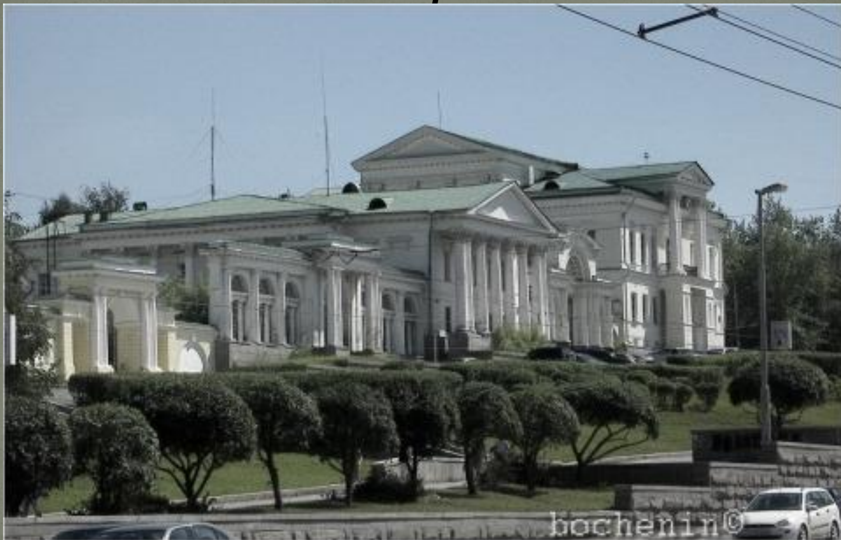
Карла Либкнехта, 44. XIX век.