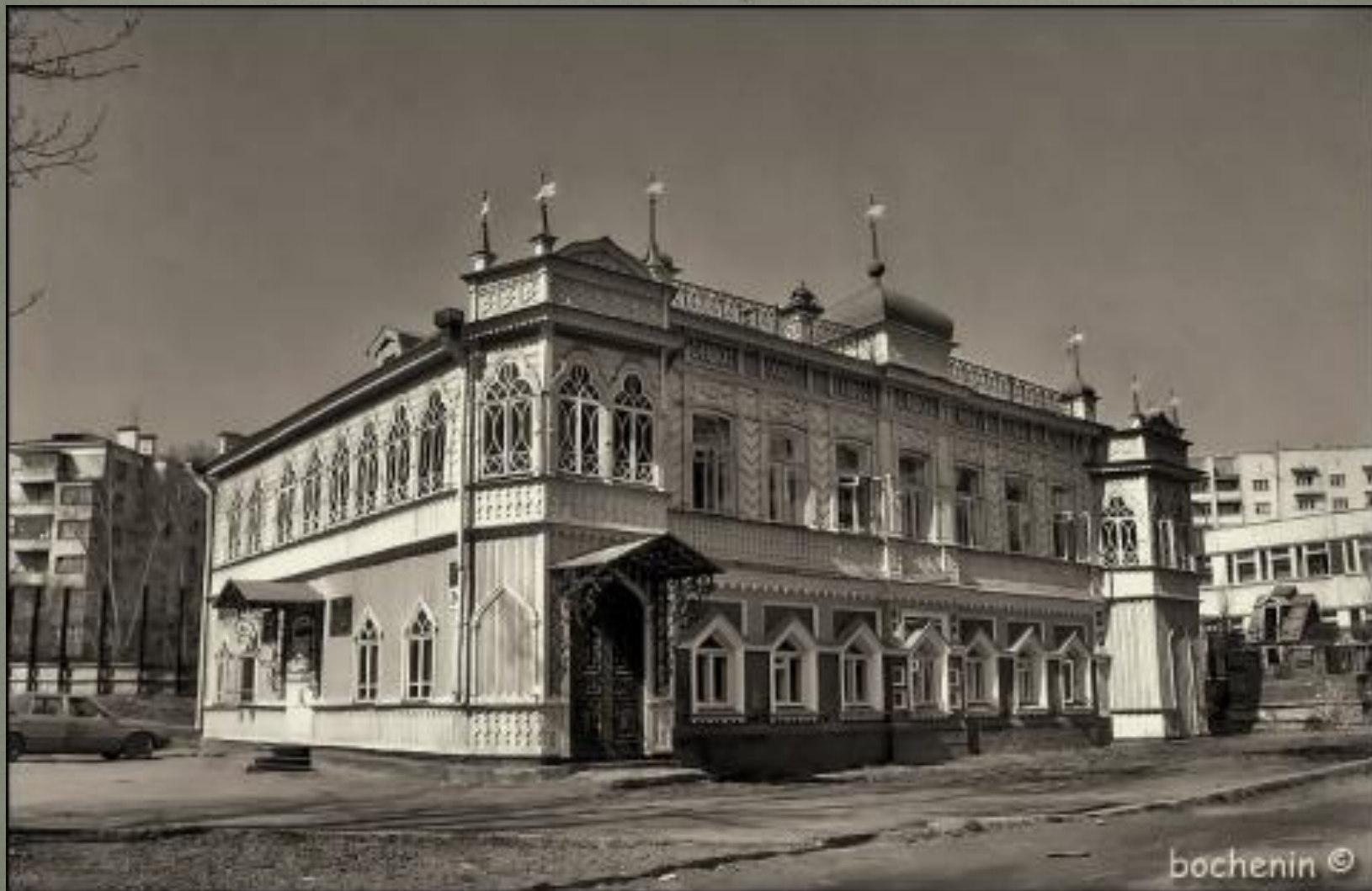
Сакко и Ванцетти, 24. 1890-е годы.