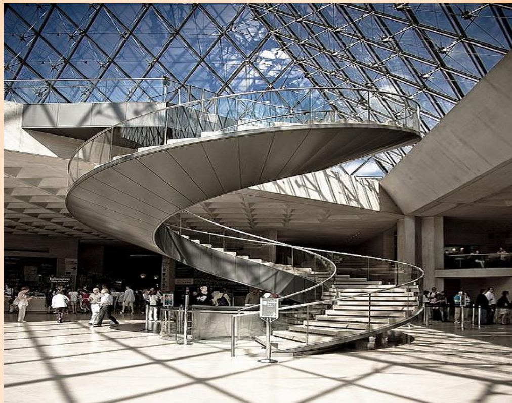
ПИРАМИДА ЛУВРА ВИД ИЗНУТРИ