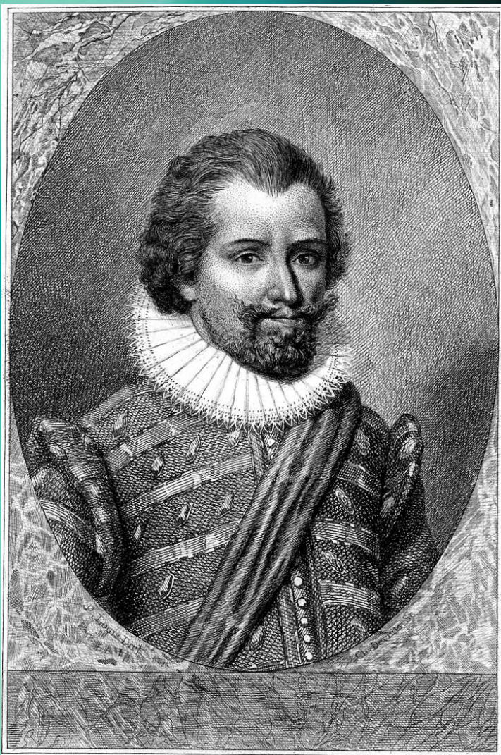
француз А. Монкретьен.