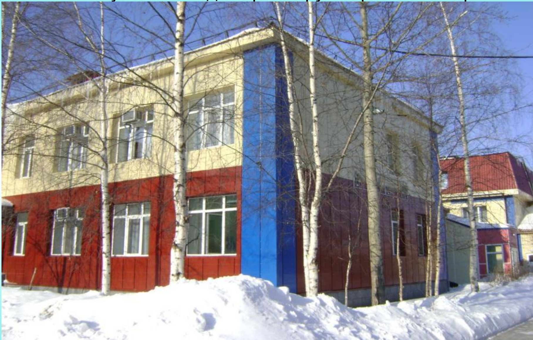
Урайский специализированный Дом ребенка. Группа № 2.