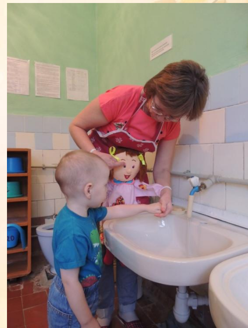
Культурно- гигиенические навыки