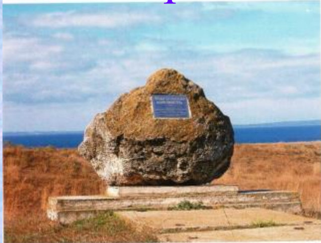
Памятный камень на месте Фанагорийской крепости, основанной в 1794 году на Тамани А.В. Суворовым