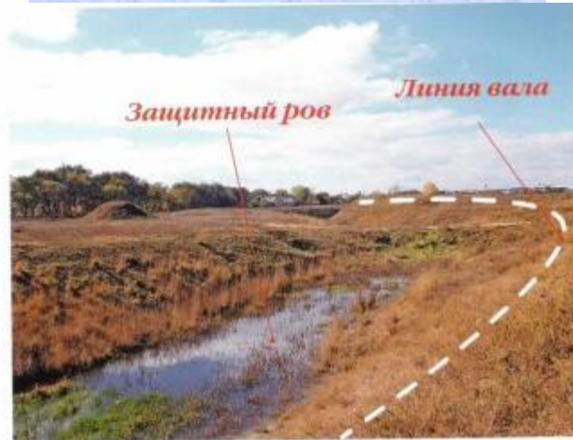
Суворовский вал, окружавший крепость, сохранился до наших дней