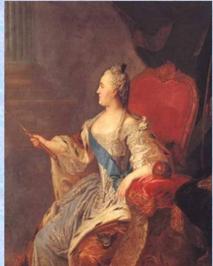
Портрет Екатерины Второй,