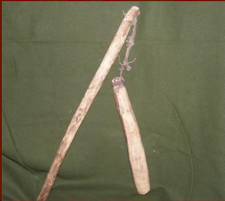
Цеп для обмолачивания зерна