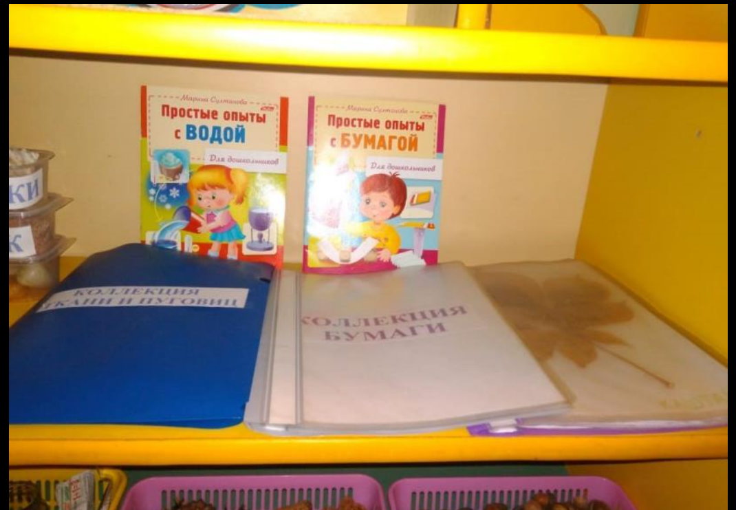
«Гербарий», «Коллекция тканей», «Коллекция бумаги»