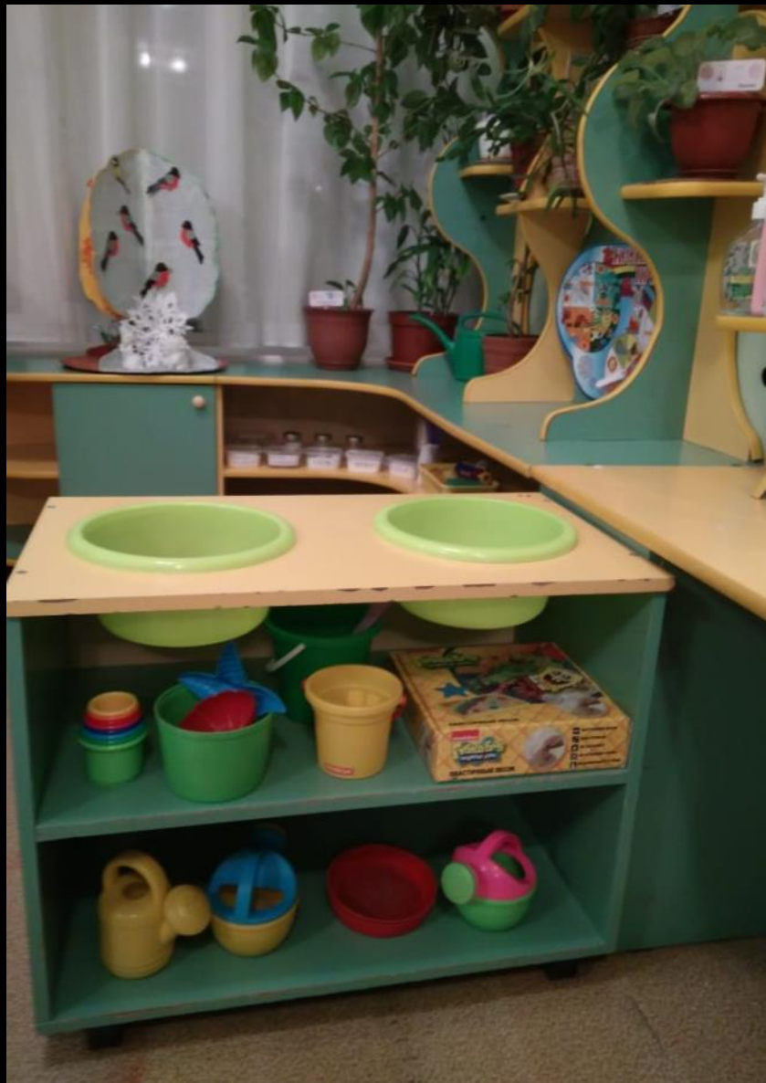
Центр воды и песка