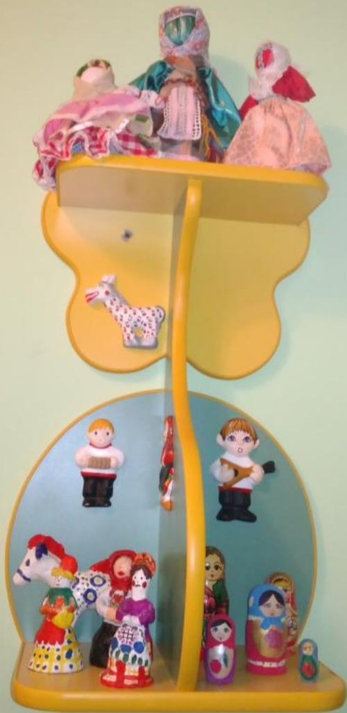
«Русской народной игрушки»