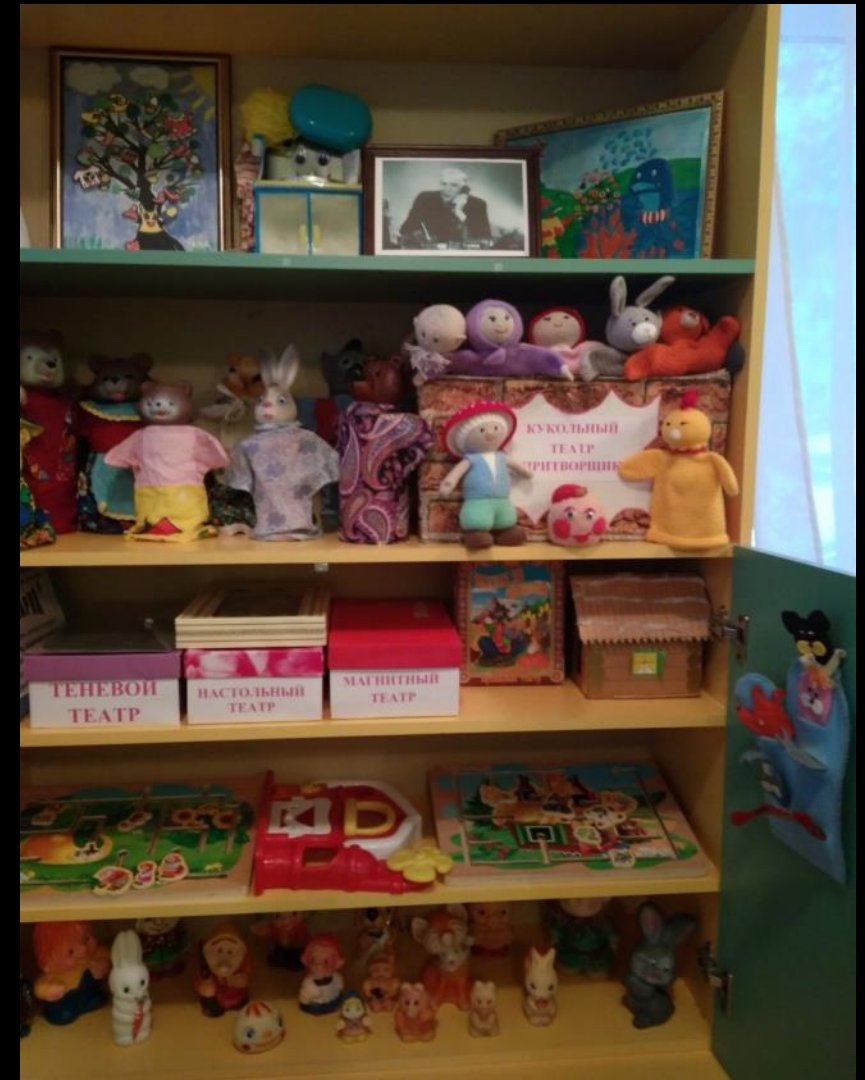
Модули пальчикового, настольного, теневого, театра би-ба-бо и декораций