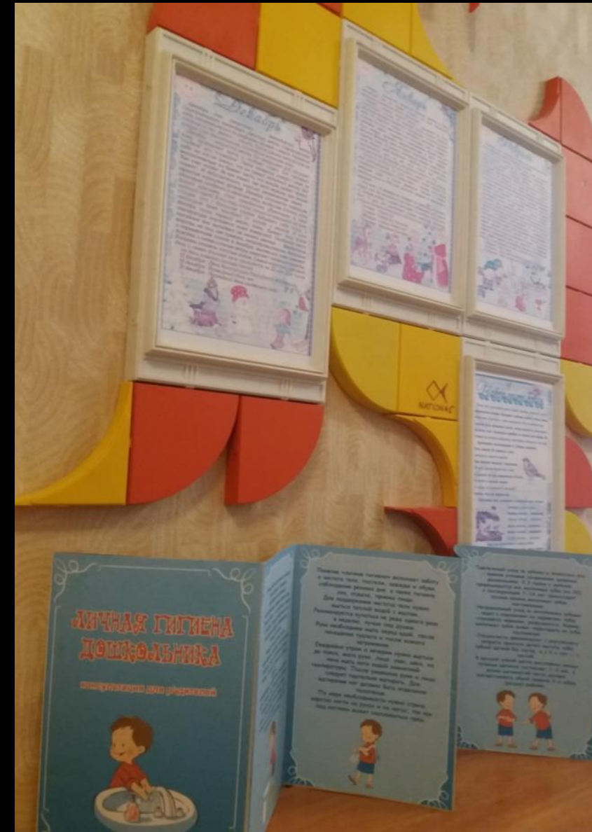
Консультации для родителей