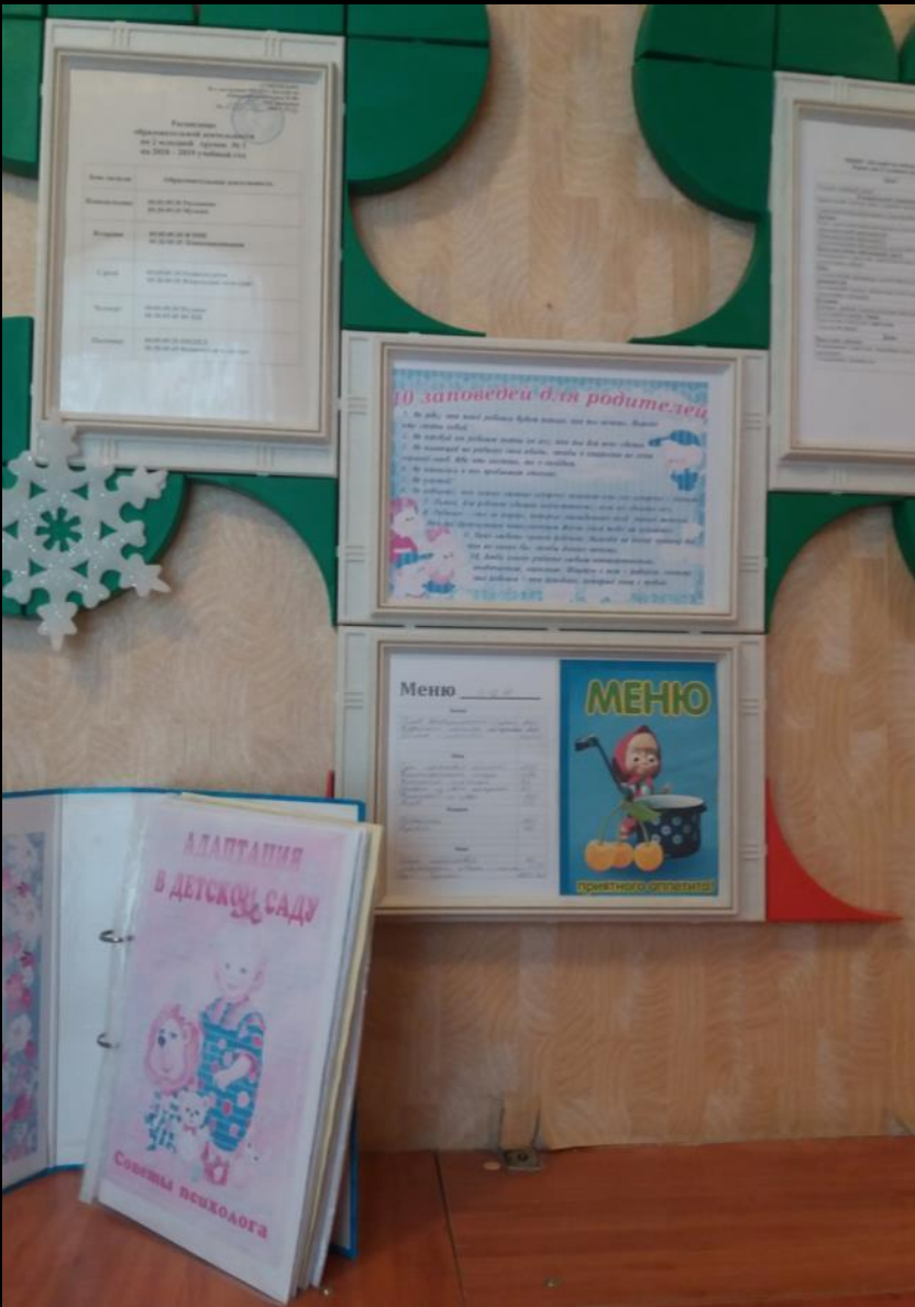
Ознакомление родителей с образовательной деятельностью группы