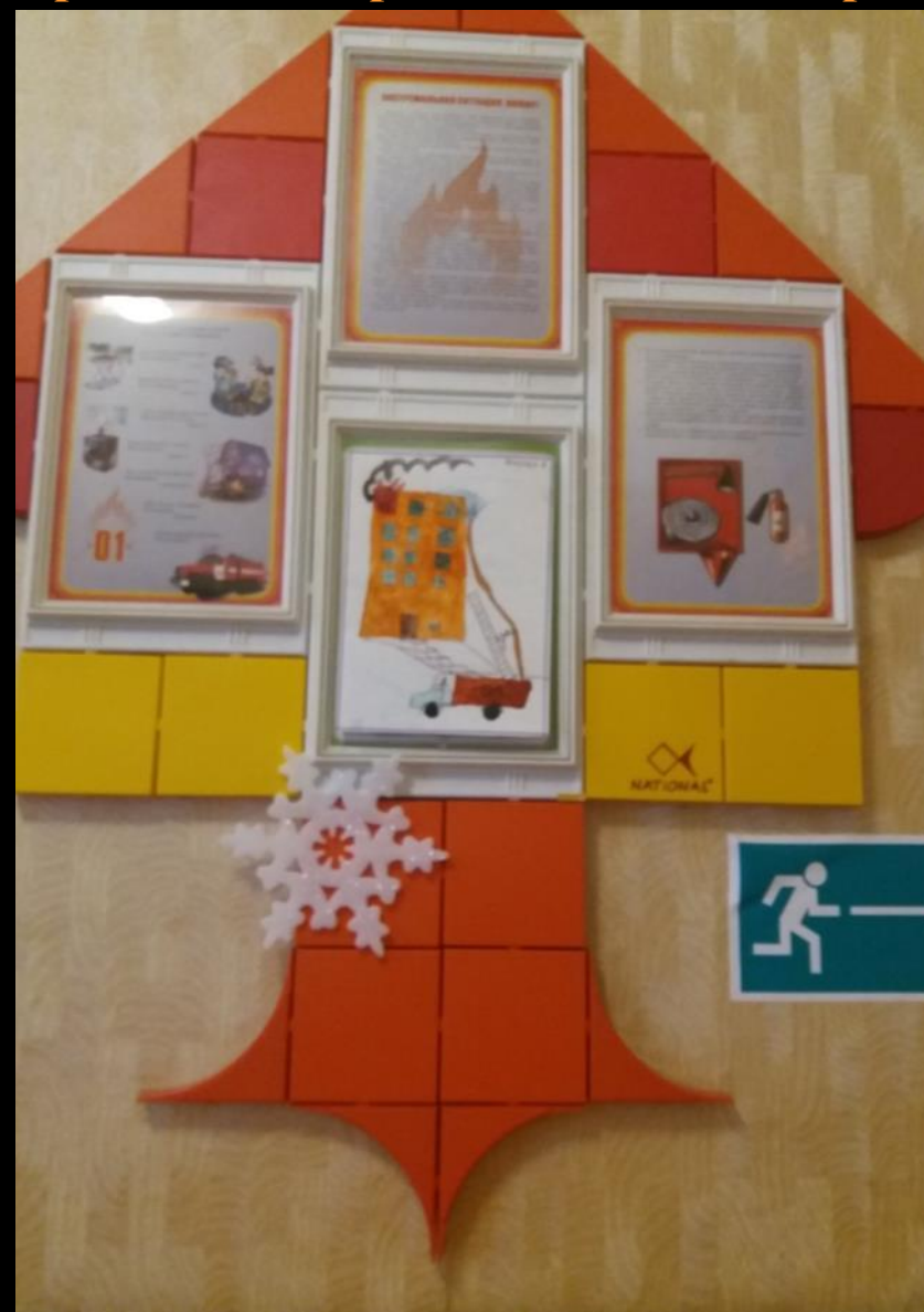
Уголок пожарной безопасности