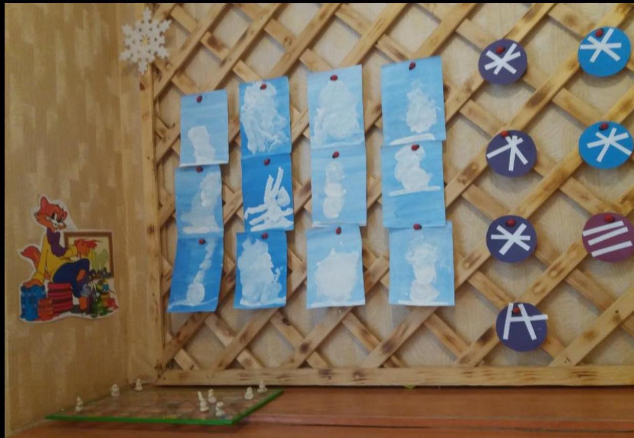
Доска для выставки творческих работ воспитанников