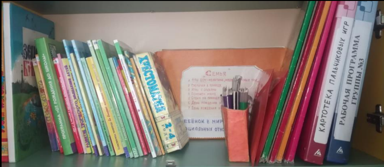
1.6. Рабочий сектор (методическая литература педагога)