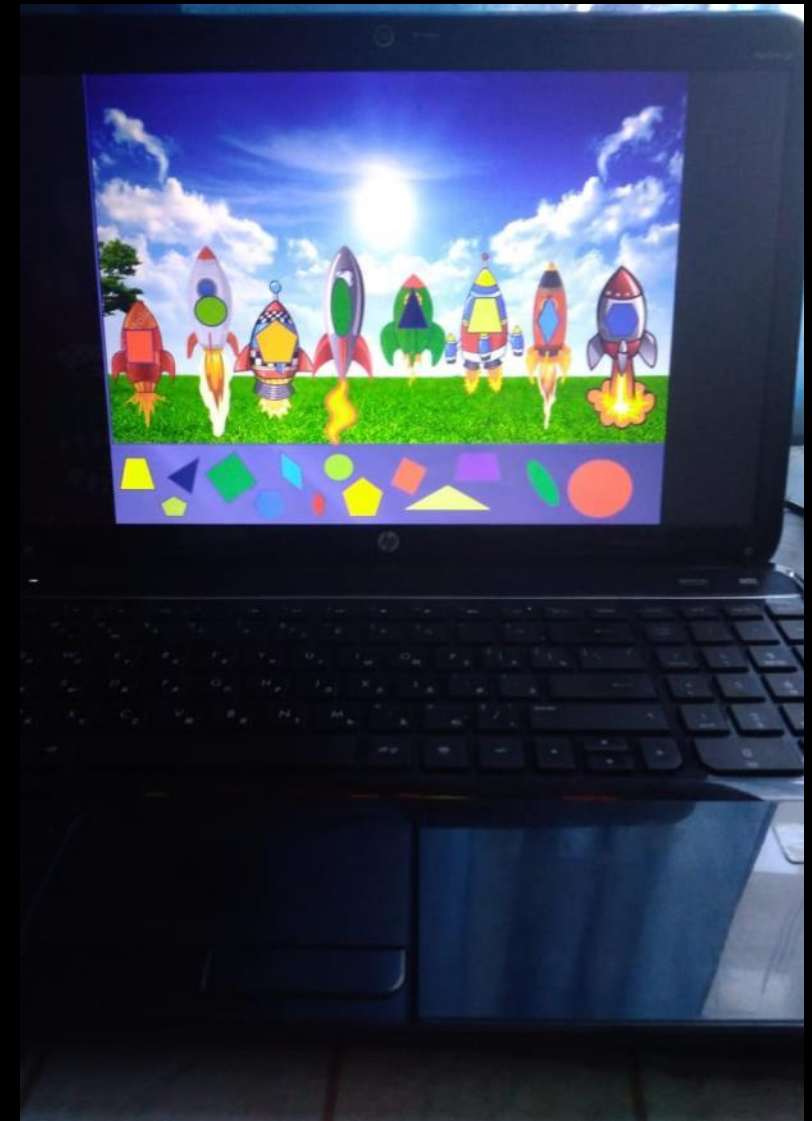
1.7. Рабочий сектор (ИКТ для педагога)