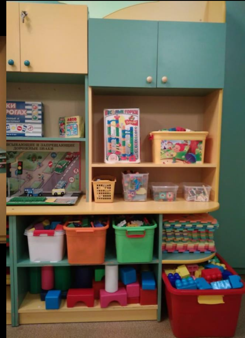
Игровая платформа «Моделирование и конструирование»