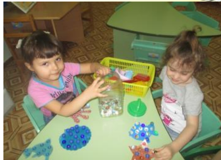
Игры с разноцветными шариками