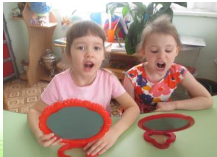
Игры с язычком