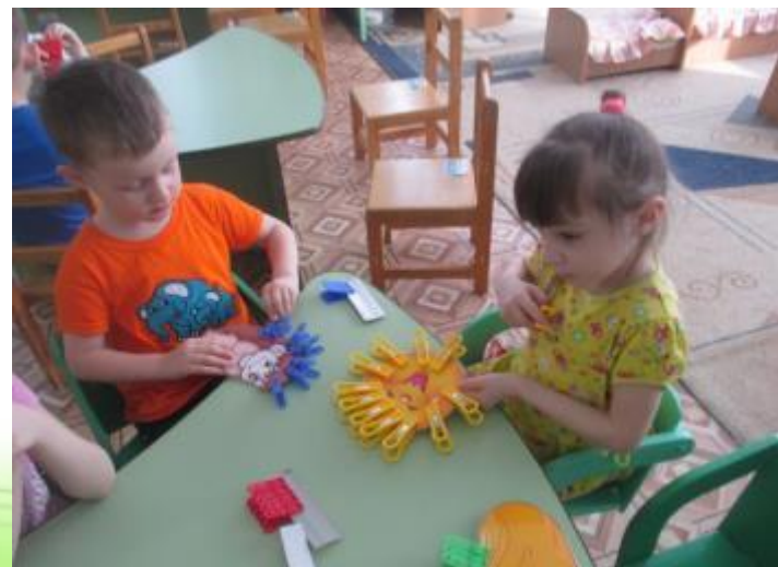
Игры с прищепками