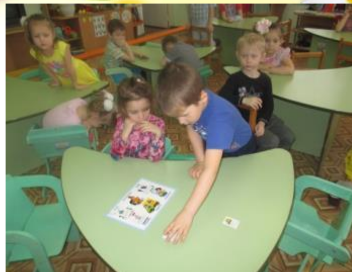
Игра «Отгадай загадку – найди профессию»