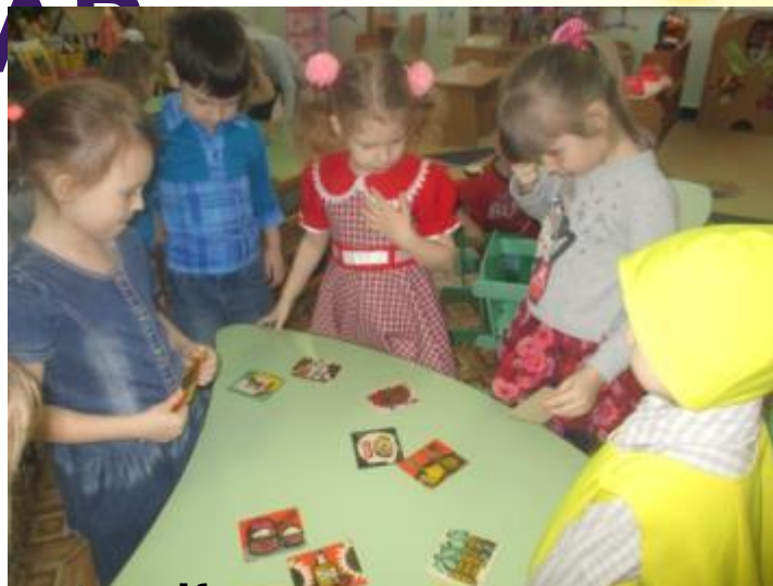
Игры: «Что нужно повару для работы?», «Какие продукты нужны повару?»