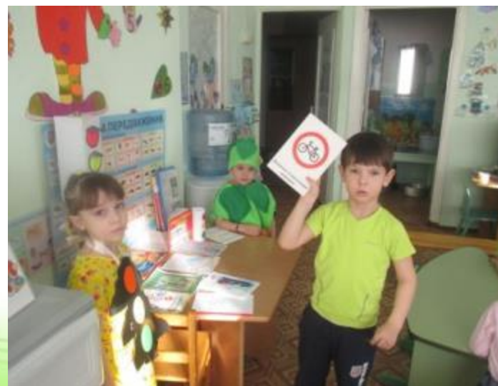
Игра «Назови дорожный знак»