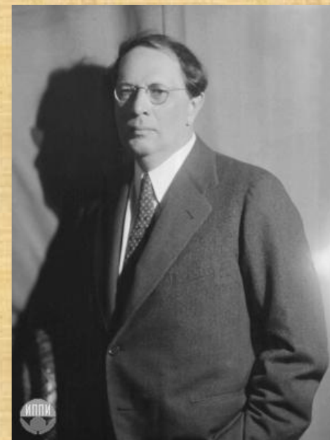
Алексей Николаевич Толстой