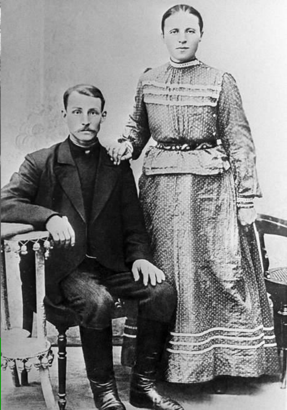
Родители С.А. Есенина