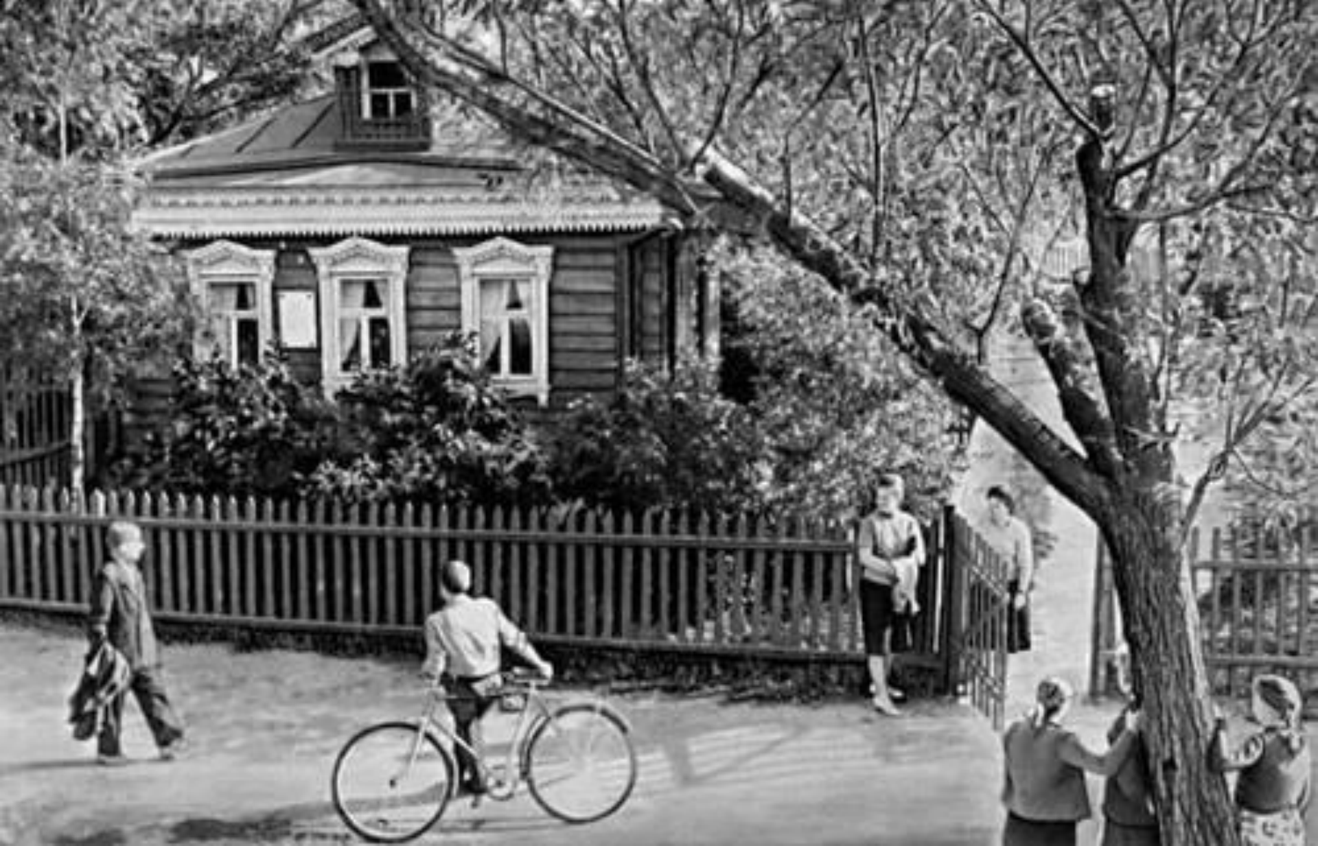
Дом-музей С.А.Есенина в селе Константиново