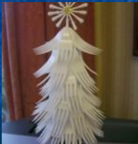
Елочка из вилок

Аппликация в детском саду к Новому году - для детей это событие надолго остается в памяти, если интересно обыграть её создание, подобрав удачный мотив, который потребует от ребёнка проявления фантазии, его личностных предпочтений и вкусов. Аппликация в детском саду к Новому году обычно начинается с создания атмосферы праздника, таинственности. Ведь Новый год - это, пожалуй, самый любимый праздник у любого человека. Каждый ожидает в это время хоть чуточку волшебства.