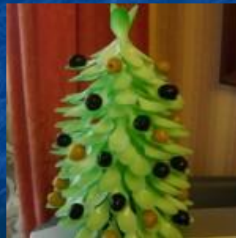
Елочка из одноразовых ложек