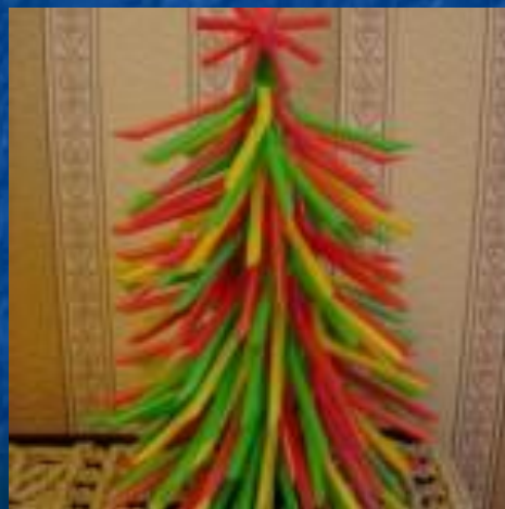
Елочка из трубочек