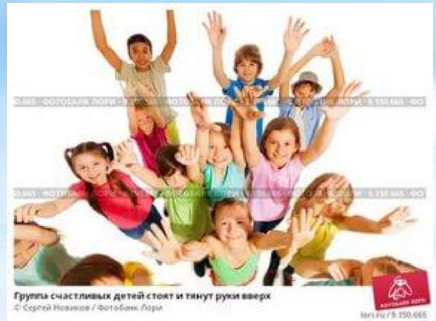
Группа счастливых детей стоит и тянут руки вверх

Присевшие дети поднимаются и вытягивают руки вверх