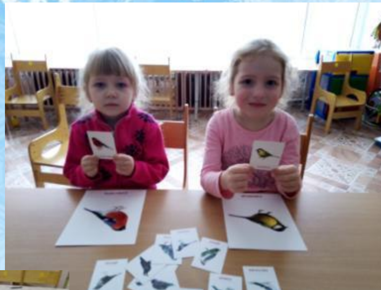
«Какая это птица»