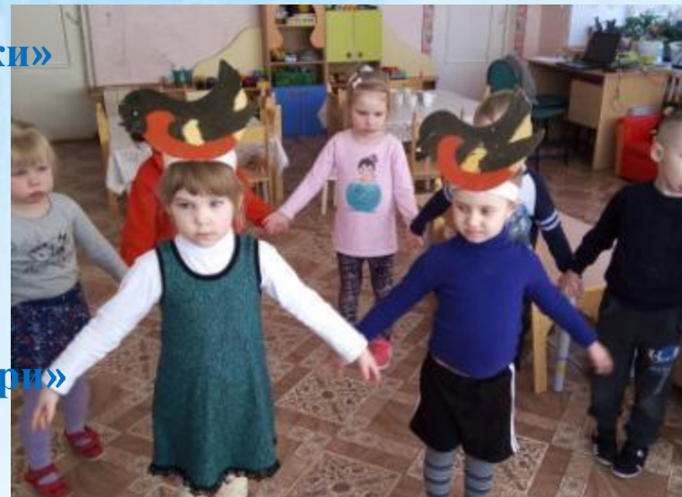
«Снегири – снегири»