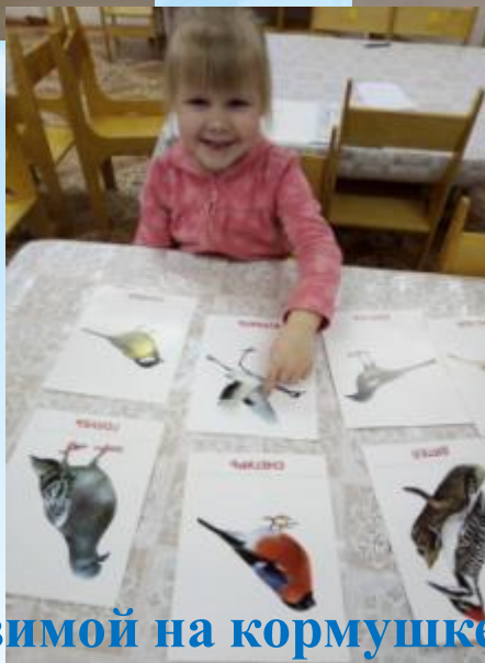
«Каких птиц зимой на кормушке не увидишь?»