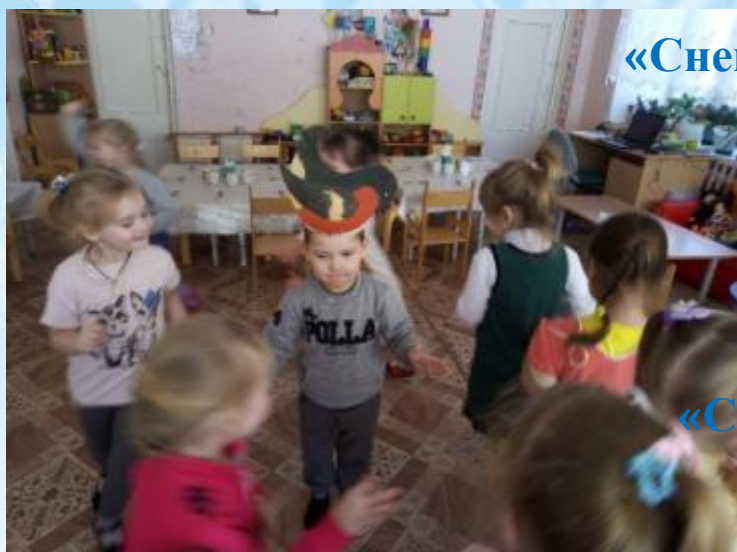
«Снегирь и птенчики»