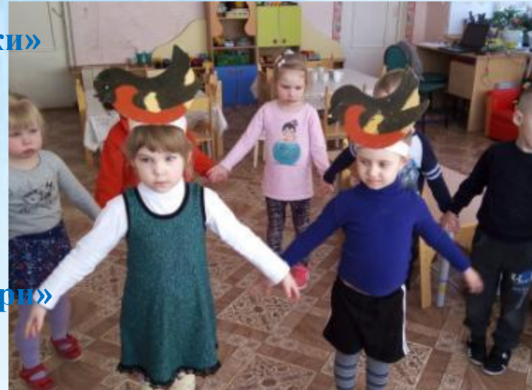
«Снегири – снегири»