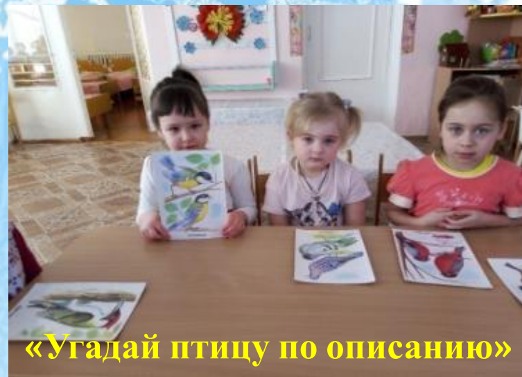
«Угадай птицу по описанию»