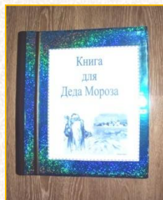
Проект «Книга для Деда Мороза»