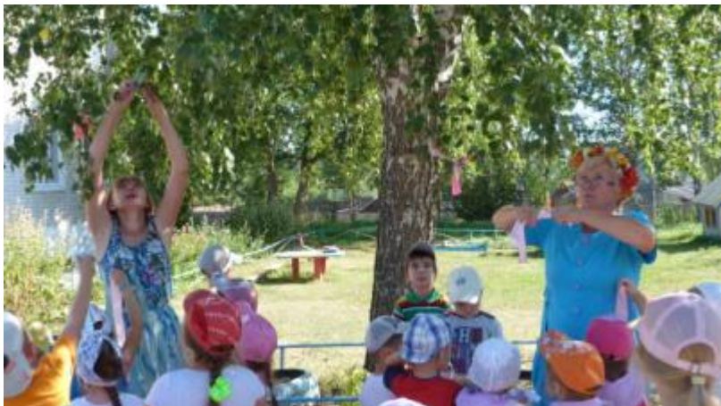
День рождения березки