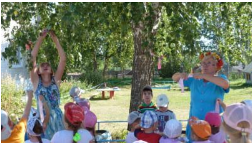
День рождения березки