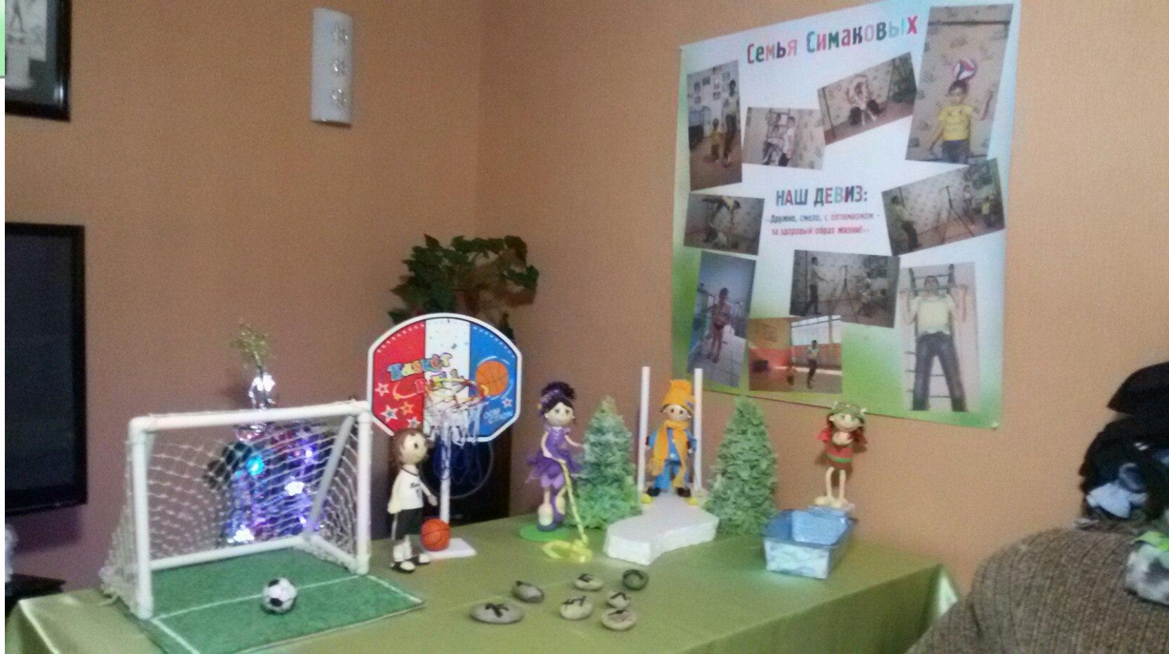
Куклы из фоамирана к конкурсу «7-я Формула успеха»