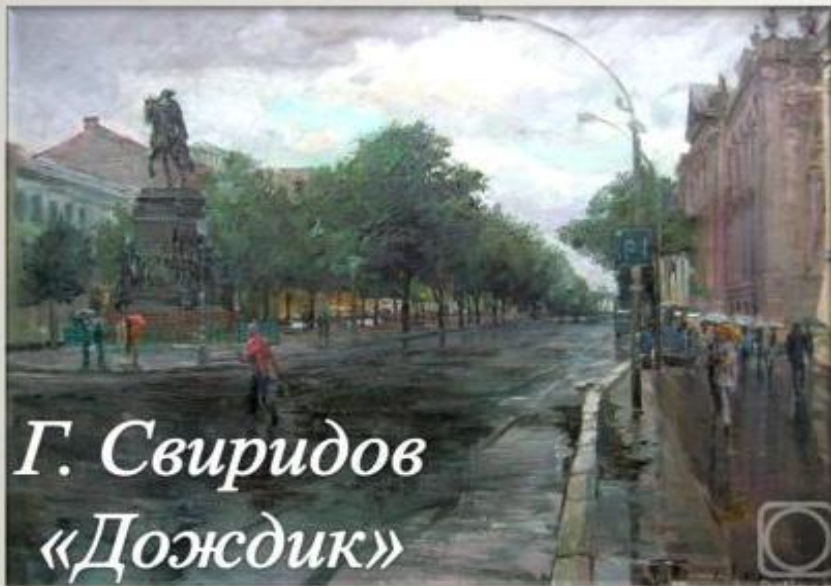
Г. Свиридов «Дождик»