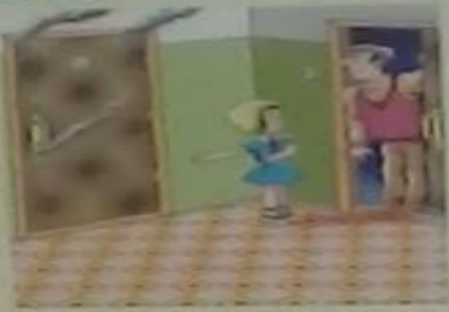
Обратись к соседям, позови на помощь