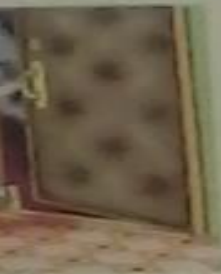
Правильно уходи из помещения, закрой за собой дверь