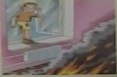
Нельзя открывать окна