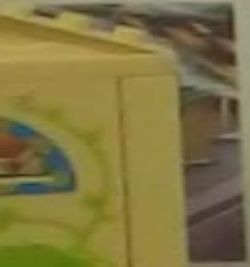
Нельзя играть с пожарной кнопкой