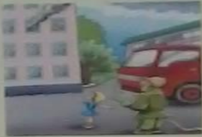
Если кто-то остался в квартире (помещении), сообщи об этом пожарным