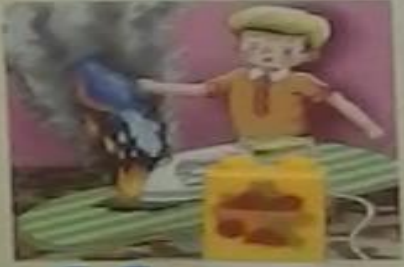
Нельзя тушить пожар самостоятельно