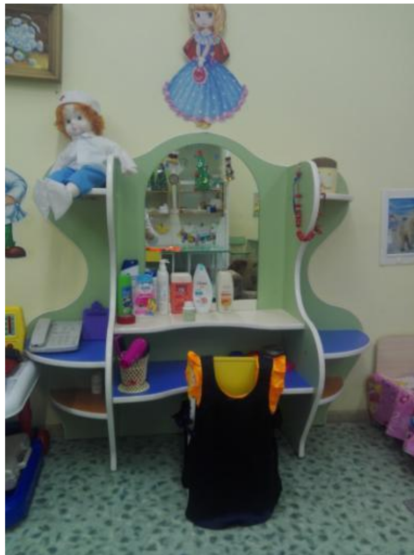
Центр сюжетно-ролевых игр