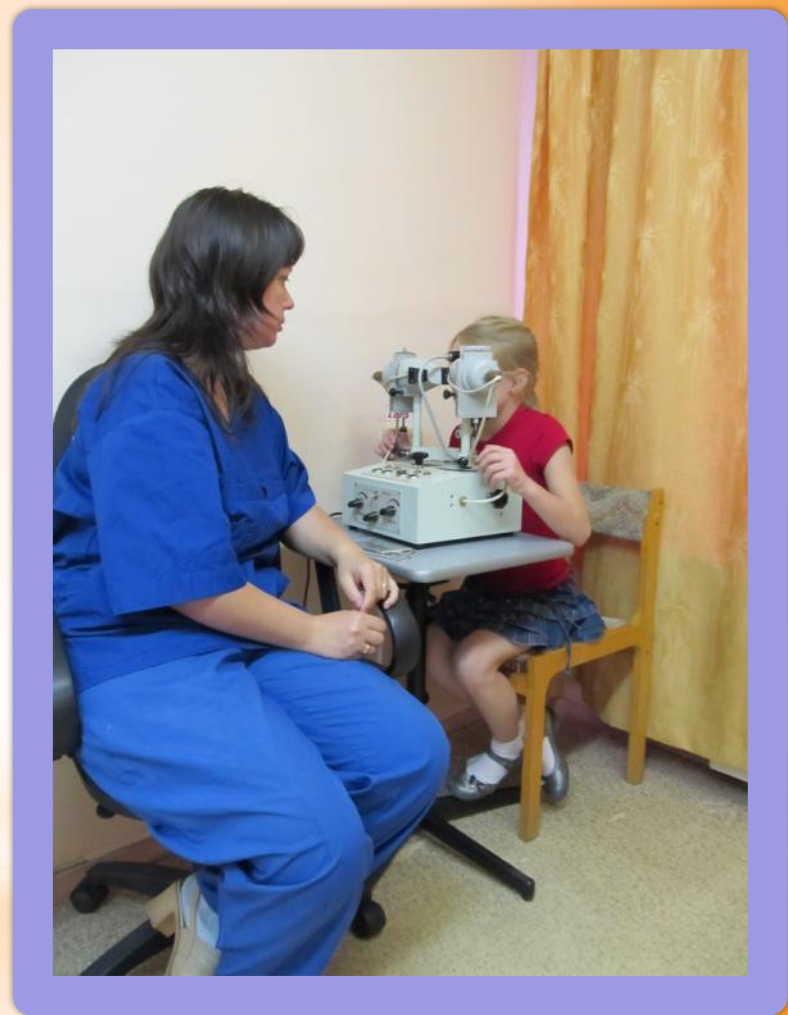
ОРТОПТИЧЕСКИЙ КАБИНЕТ, ЛЕЧЕНИЕ НА АППАРАТАХ