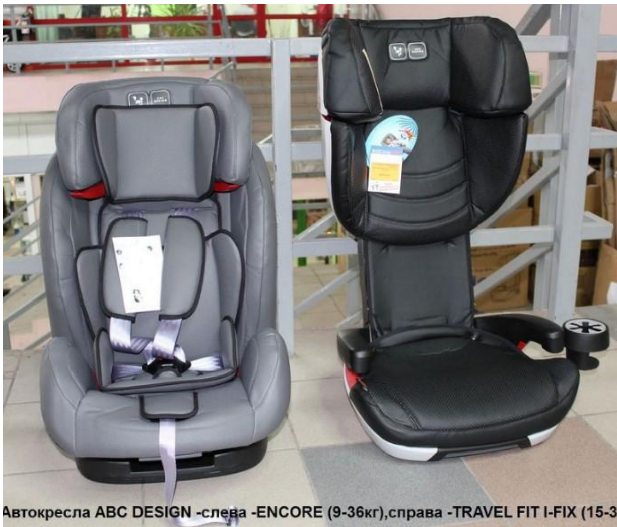
Автокресла ABC DESIGN -слева -ENCORE (9-36кг),справа -TRAVEL FIT I-FIX (15-36кг)