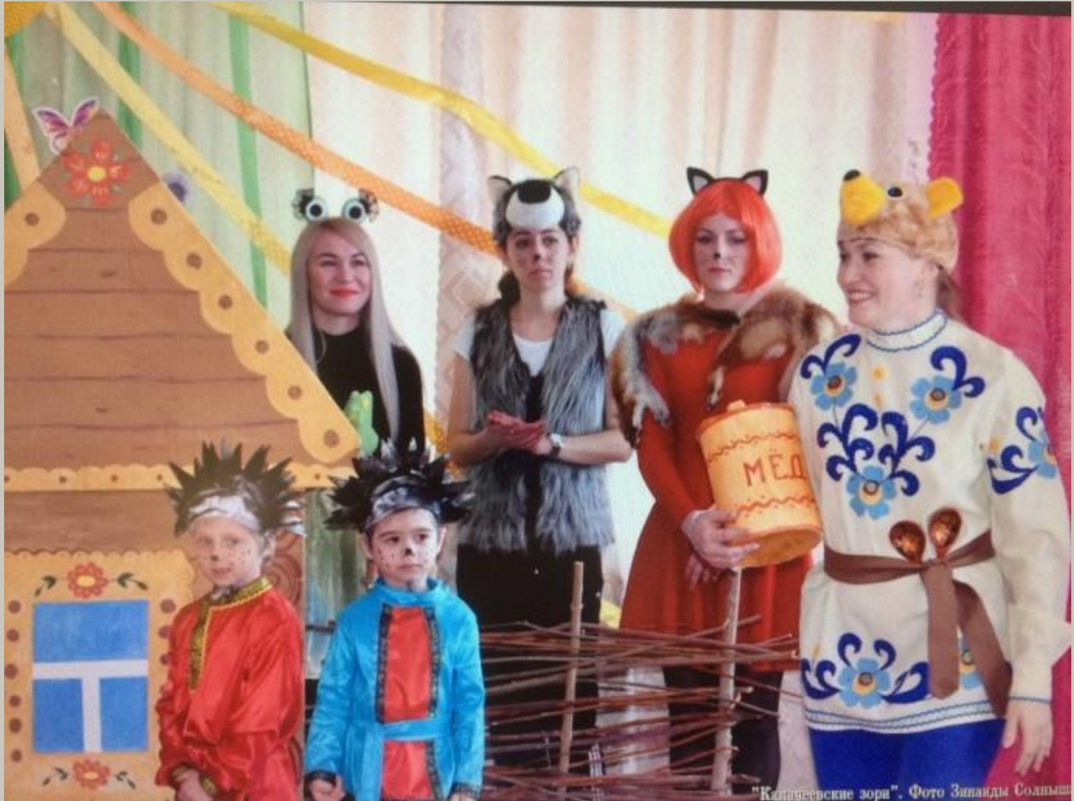
"Калининские зори".