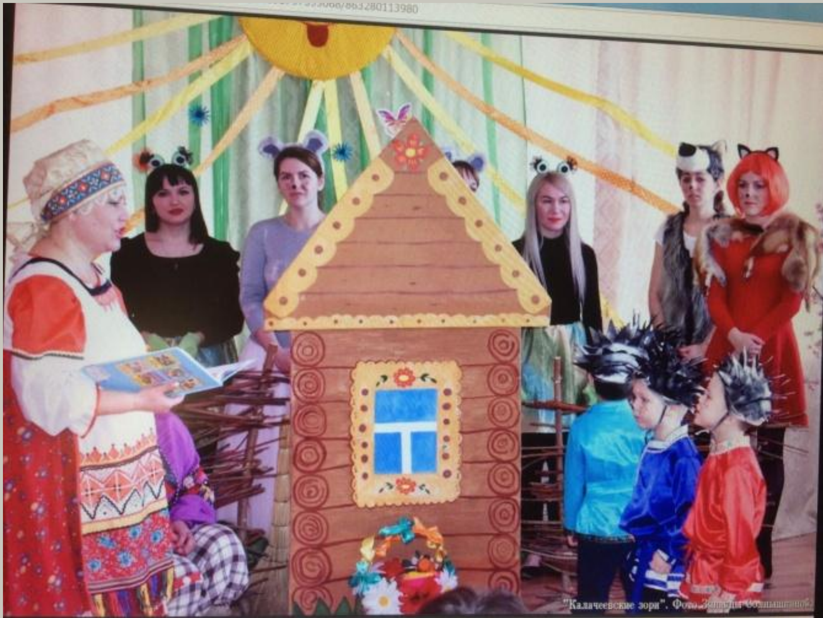
"Калачевские зори".