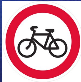
Движение на велосипедах запрещено