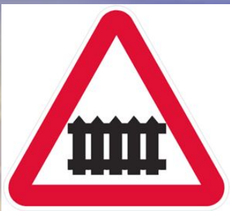
Железнодорожный переезд со шлагбаумом