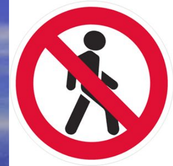
Движение пешеходов запрещено