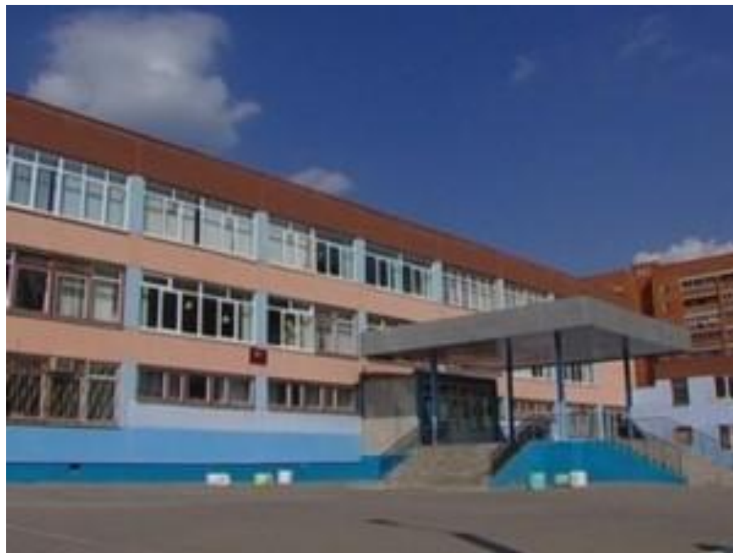
Муниципальное бюджетное общеобразовательное учреждение гимназия №2