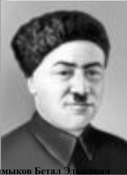
Калмыков Бетал Эдыкович

В 1920—30 председатель Кабардино-Балкарского областного исполкома, в 1930—38 1-й секретарь Кабардино-Балкарского обкома ВКП (б).