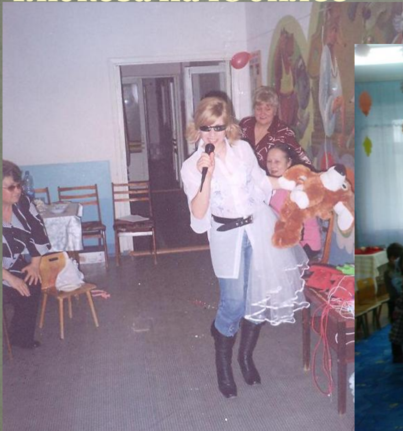
Глюкоза на Юбилее