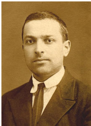
Выготский Лев Семенович