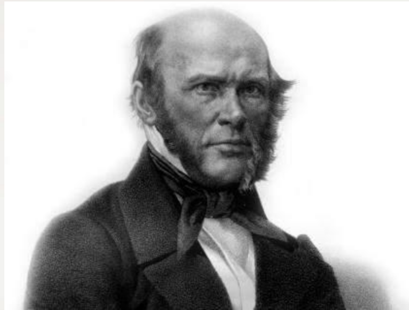
Николай Иванович Пирогов