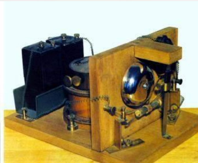
Александр Степанович Попов