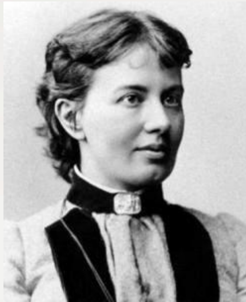
Софья Васильевна Ковалевская