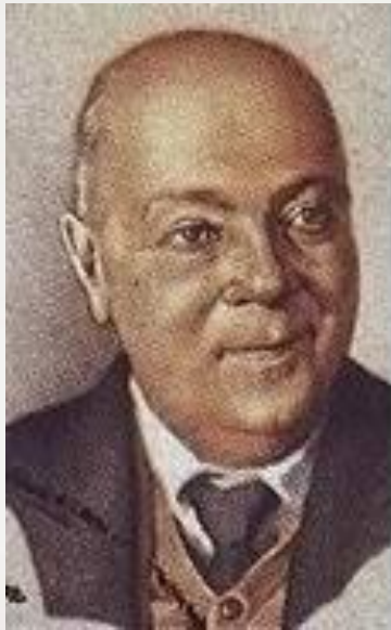
Александр Евгеньевич Ферсман