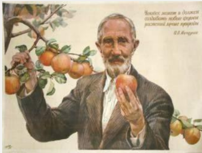
Иван Владимирович Мичурин