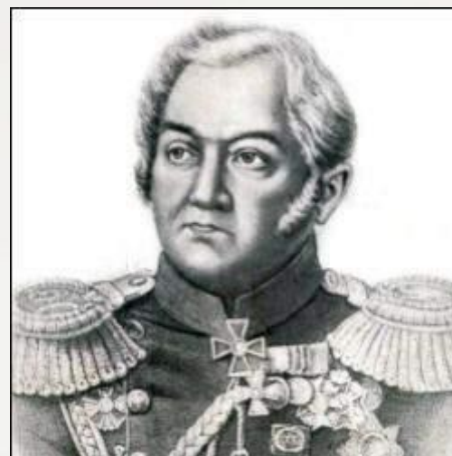
Михаил Петрович Лазарев