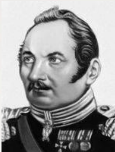
Фаддей Фаддеевич Беллинсгаузен