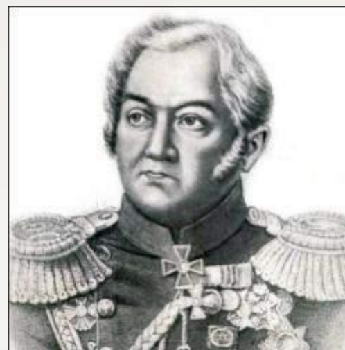
Михаил Петрович Лазарев