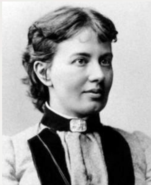
Софья Васильевна Ковалевская