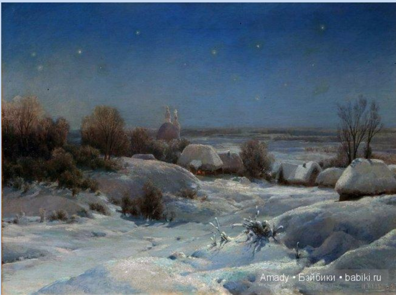
Иллюстрация «Украинская ночь» И. Вельца