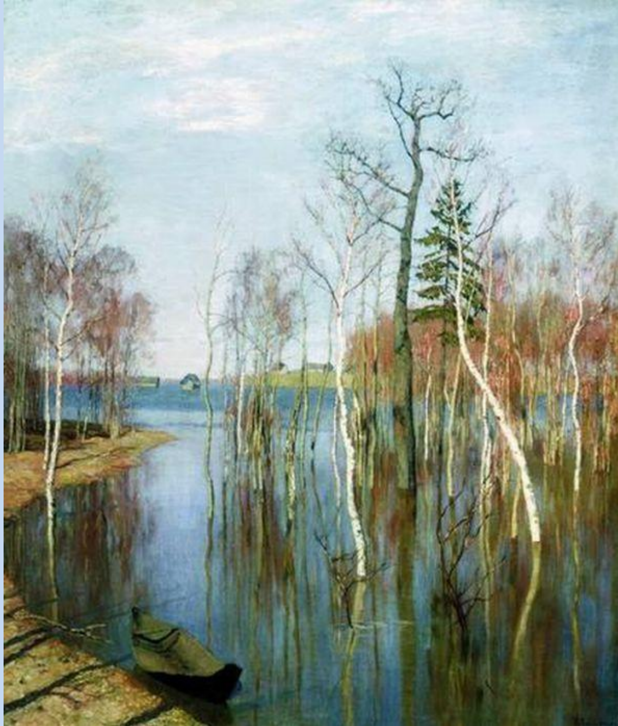
Иллюстрация «Весна. Большая вода» И.И. Левитана