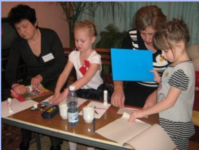
«Бабушка и я, лучшие друзья.»

- Давно доказано учёными-психологами, что занятия живописью и лепкой чрезвычайно благотворно влияют и на детей, и на взрослых.