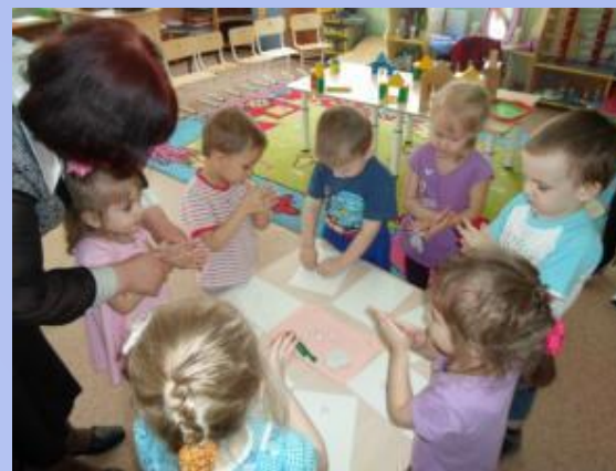
- Продуктивная деятельность в кружковой работе

- Продуктивная деятельность в свободных играх и развлечениях.