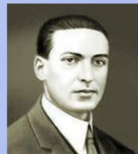
Л. С. Выготский

Так же неслучайно Л. С. Выготский называл рисование - «графической речью».