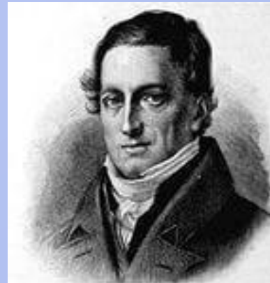
Фихте И. Г.