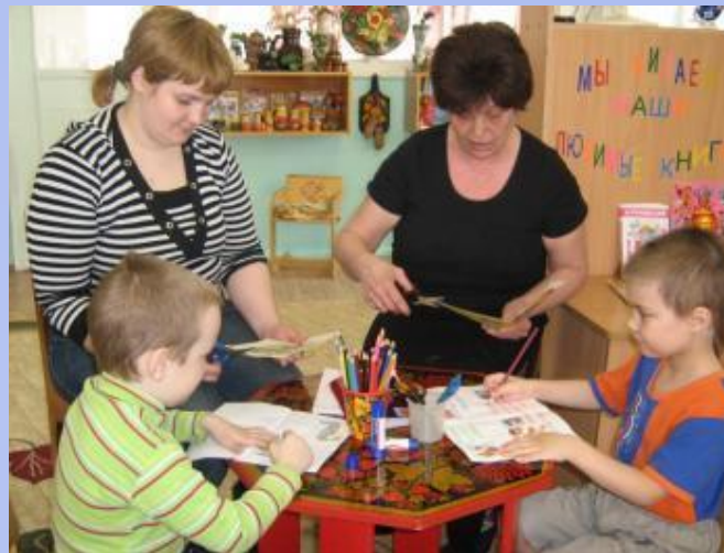
«Вместе дело спориться.»

- Совместная продуктивная деятельность доставляет удовольствие как детям, так и взрослым.