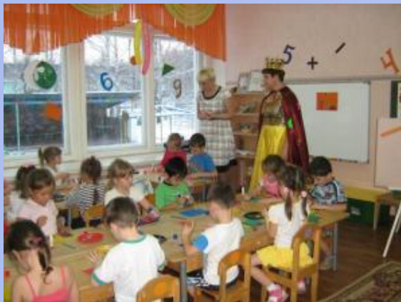
- Продуктивная деятельность в НОД.

Продукты деятельности у детей в детском саду бывают разными можно разделить продуктивную деятельность детей на следующие составляющие или направления: