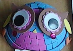
БОЧКАРЕВ А. "КОСМИЧЕСКАЯ ПТИЦА"