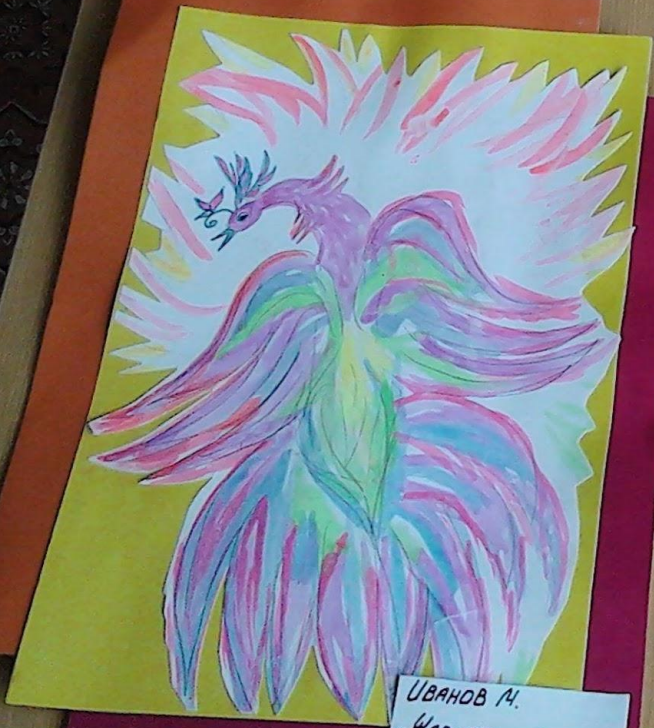
ИВАНОВ И. "НАР-ПТИЦА"