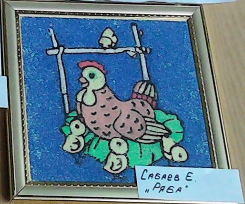
САБАЕВ Е. "ПЯСА"