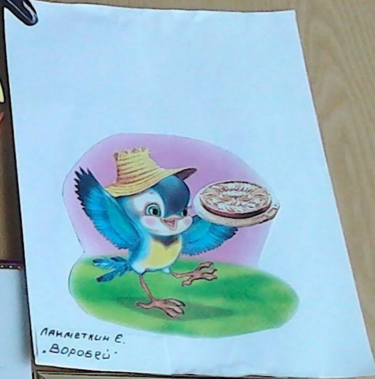
ЛАНКЕТКИН Е. "ВОРОБЕЙ"