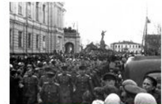
9 мая 1945 года в Тамбове

Первый День Победы праздновался так, как, наверное, отмечалось очень мало праздников в истории СССР и России. Люди на улицах поздравляли друг друга, обнимались, целовались и плакали. 9 мая, вечером в Москве был дан Салют Победы, самый масштабный в истории СССР: из тысячи орудий было дано тридцать залпов. Прошло 70 лет.