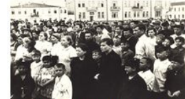
22 июня 1941 год Ленинская площадь