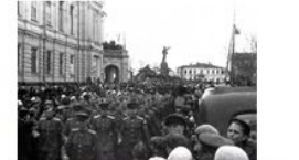
9 мая 1945 года в Тамбове

Первый День Победы праздновался так, как, наверное, отмечалось очень мало праздников в истории СССР и России. Люди на улицах поздравляли друг друга, обнимались, целовались и плакали. 9 мая, вечером в Москве был дан Салют Победы, самый масштабный в истории СССР: из тысячи орудий было дано тридцать залпов. Прошло 70 лет.