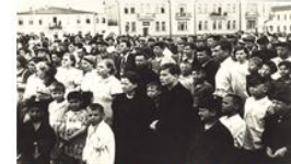
22 июня 1941 год Ленинская площадь