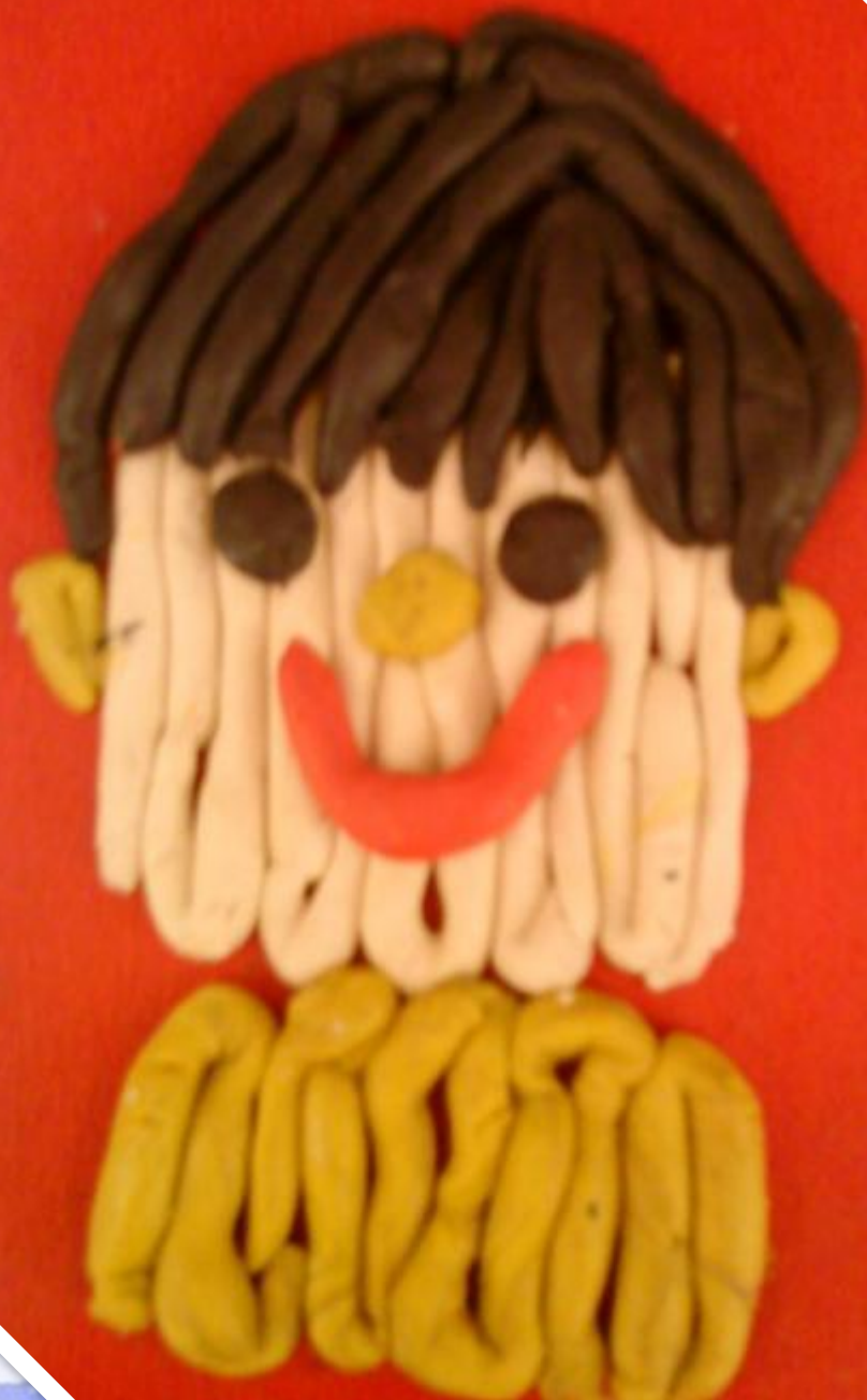
Автопортрет Серези Недоступова (выполнен с помощью пластилина)