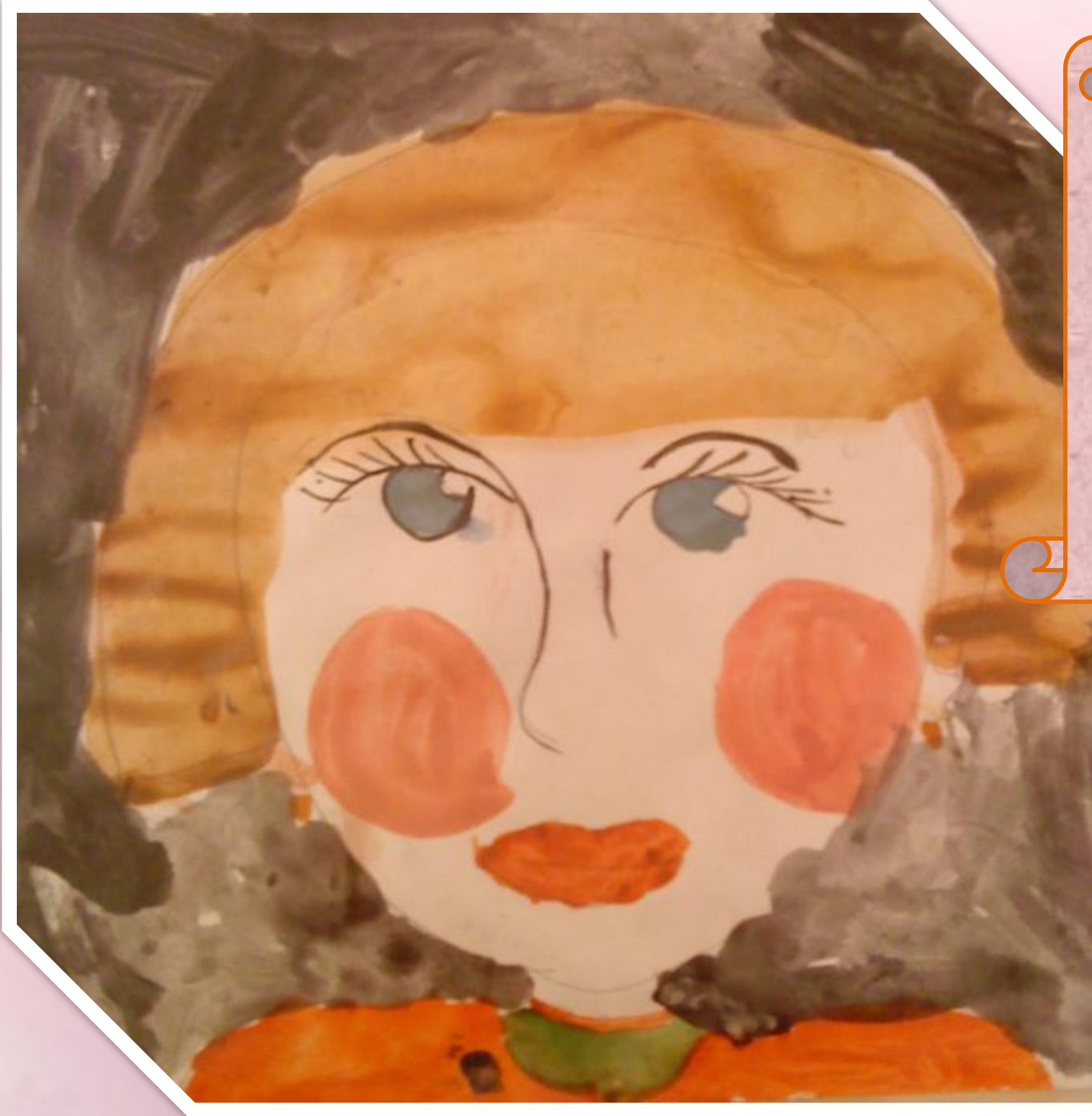
Автопортрет ет Сони Сынкковой (выполнен с помощью акварели)