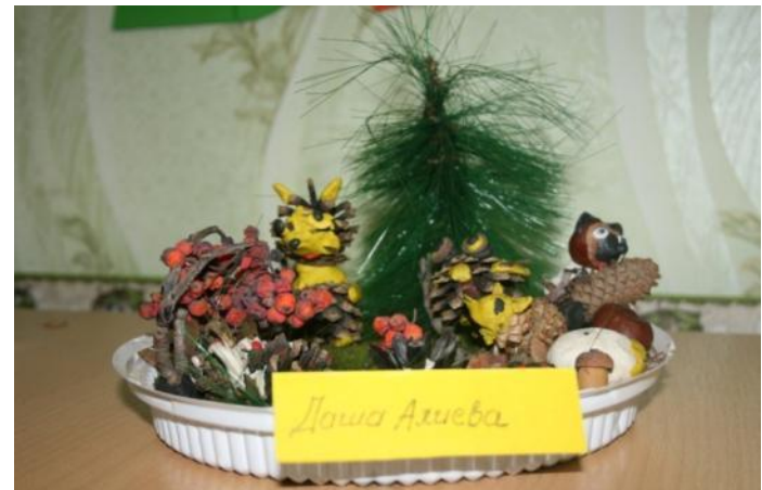
«Домик для гномиков»