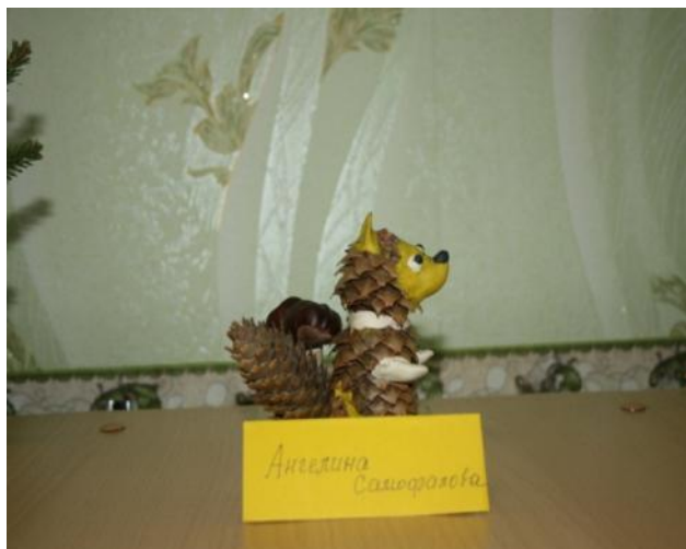
«Запасы на зиму»