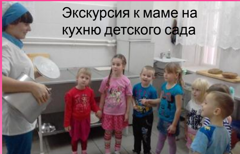
Экскурсия к маме на кухню детского сада