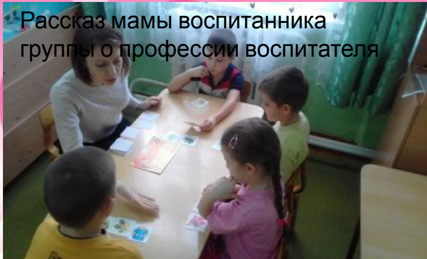
Рассказ мамы воспитанника группы о профессии воспитателя