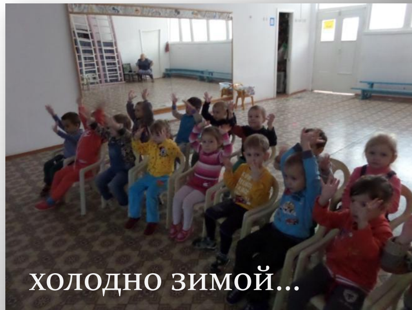
НЕ холодно зимой...