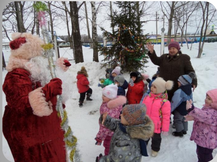
Деда Мороза в гости звали- нашу елку показали...